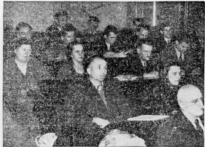
Zasedanja Ljudske skupščine

ekonomsko nadzorstvo nad poslovanjem in delom posameznih delovnih kolektivov in nad izpolnjevanjem njihovih obveznosti do skupnosti. S tem bodo zbori proizvajalcev postali izredno važno orodje za koordinacijo na področju gospodarstva, seveda v tisti meri, kolikor bo taka koordinacija zares potrebna za skupno družbeno korist. Očitvidno je torej, da zbori proizvajalcev zaradi vseh teh svojstev bistveno razširjajo sistem socialistične demokracije in pospešujejo njegov nadaljnji razvoj.