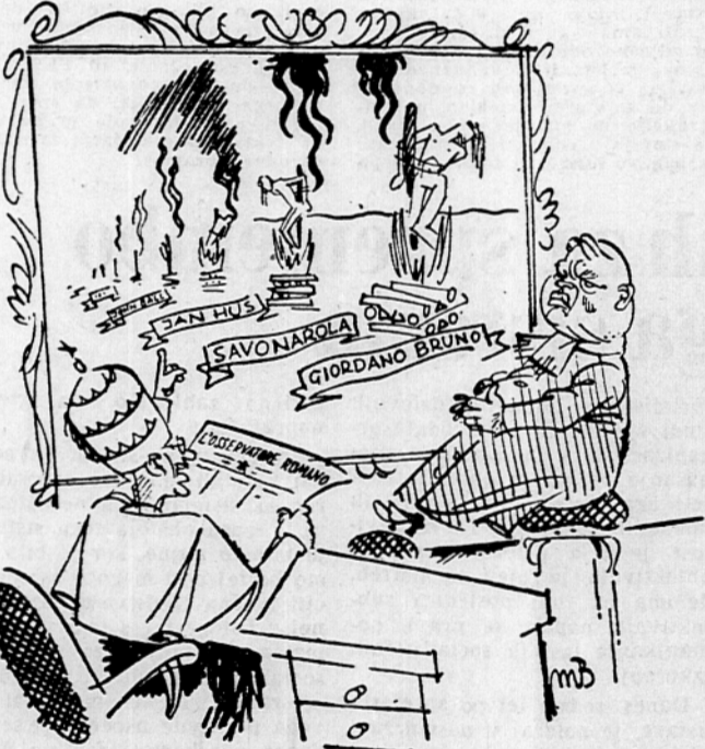
PAPEZ: Dragi moj, to so bili lepi časi! Res škoda, da so minili.

Ze več kot mesec dni leži v tržaških skladiščih okroglo 350 ton riža, namenjenega Jugoslaviji. Pošliko so ustavili italijanski carinski organi v Trstu, čeprav je italijanska »Banca commerciale« se dobila od jugoslovanskih podjetij plačan ves riž. Kakor se je zvedelo, je bila dobava riža ustavljena na zahtevo italijanskih oblasti, ki se izgovarjajo, da niso opravljene nekatere carinske formalnosti. Znano pa je, da na italijanski strani v zadnjem času onemogočajo prodajo riža Jugoslaviji.