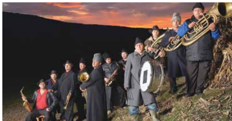
Na fotografiji: Fanfare Ciocărlia