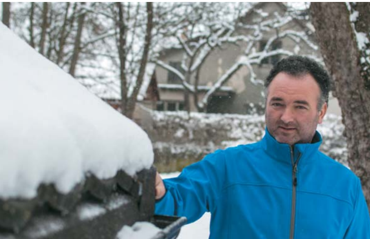
Njegove roke so s strešniki prekrile že mnoge strebe

Slovenski regionalno razvojni sklad iz Ribnice namerava v kratkem objaviti ugodna posojila podjetništvu v kombinaciji z nepovratnimi sredstvi. Na OOOZ Cerknica bo Sklad za vse zainteresirane izvedel delavnico na zgoraj navedeno temo. O terminu delavnice boste vsi zainteresirani obveščeni. Sporočite nam svoj interes.