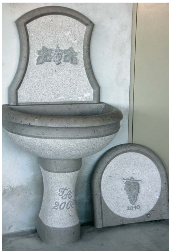
Korito z reliefnimi ornamenti

Hvala za pogovor, mladi mojster. Želim vam uspešno strokovno in poslovno pot.