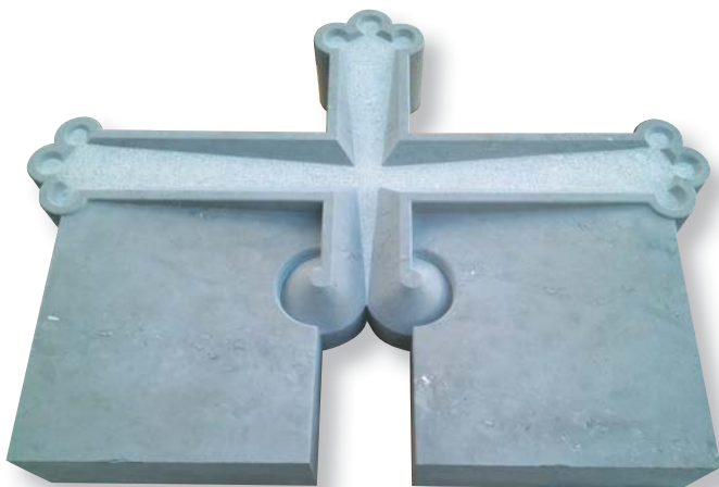
Nagrobni plošči, povezani s križem