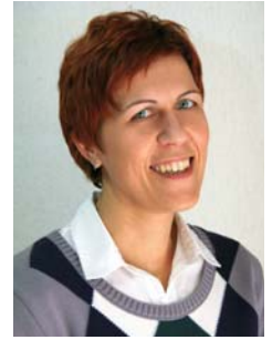
Pripravlja Irena Dolgan