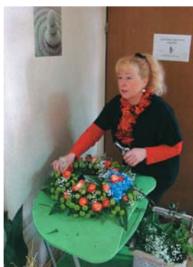
So pa tudi trenutki resnobnosti in pietete

Več bi se lahko posluževali storitev, ki jih nudi ZDOPS. Člani imajo pri tem precejšnje ugodnosti. ZDOPS se je dodobra uveljavil kot pogajalec med socialnimi partnerji na državnem nivoju. To bi kazalo izkoristiti, saj je delovno področje ekonomsko socialnega sveta široko. Treba je biti zraven tedaj, ko se zakonodaja oblikuje. Kasnejši popravki so zmeraj zahtevnejši, kot bi bili napori v času oblikovanja predpisov. A je za to treba biti buden, dovolj strokovno ozaveščen, pa še prepričljiv moraš biti, da kaj dosežeš.