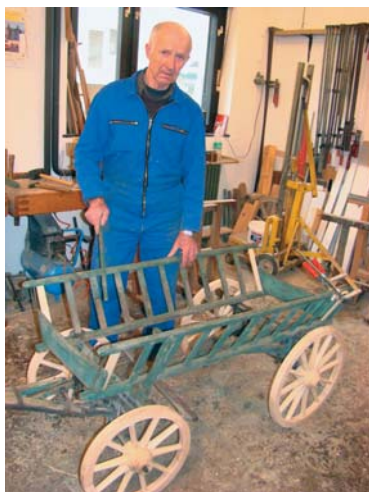
Sožije starega z novim: vse mora biti skladno, da voz lahko služi svojemu namenu