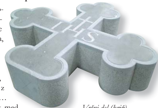
Vrtni del (križ) kužnega znamenja