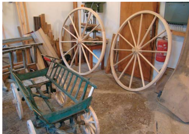
Kolesa in vozovi, danes za nostalgijo, nekoč za preživetje

Vrhniški obrtniki so se že pred 2. svet. vojno povezali v nabavno in prodajno obrtniško zadrugo. Tik pred vojno so načrtovali postavitev razstavnega paviljona, a v začetku leta 1940