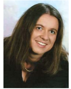
Pripravljala Barbara Grum Vogrin