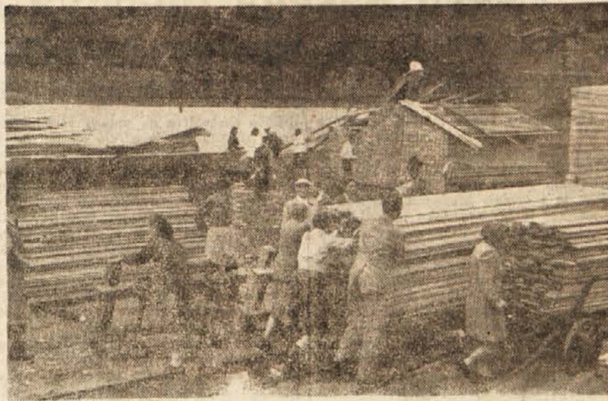
Pri zlaganju desk