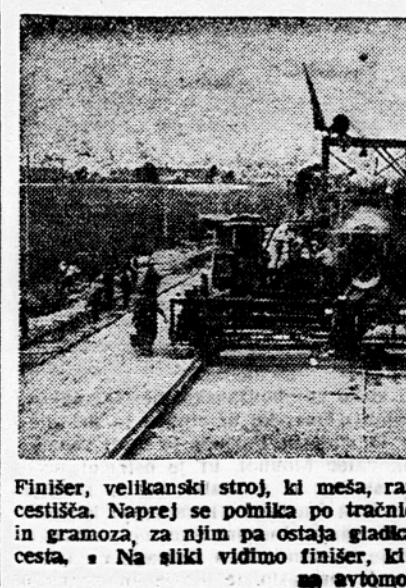
Finišer, velikanski stroj, ki meša, razsipa, ravna in nabija beton pri gradnji cestišča. Naprej se potnika po tračnicah. Pred njim je utrjen nasip zemlje in gramoza, za njim pa ostaja gladka sedem in pol metra široka betonska cesta. Na sliki vidimo finišer, ki gradi zadnje metre betonskega cestišča na avtomobilski cesti.

morajo položiti še več kilometrov betonskega cestišča. Precej dela bodo morali opraviti na več metrov visoki nastpih pri nadvozhih v bližini