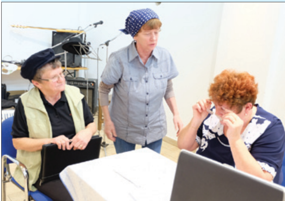
V kulturnom programu so gorstaučili člani gledališke skupine Veseli pajdaši iz Števanovec.