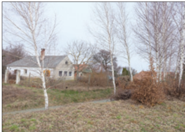
Šiničin krošeu na Janezovom brgej