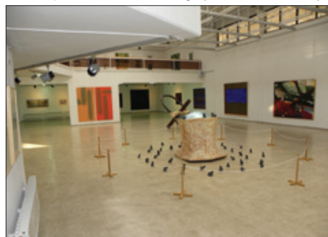
Del razstave, na kateri se predstavlja 44 umetnikov od najstarejše do najmlajše generacije s sedemdesetimi deli

predstavitev del izključno pomurskih umetnikov. Izpostavil bi dejstvo, da je v dneh, ko je del stalne zbirke