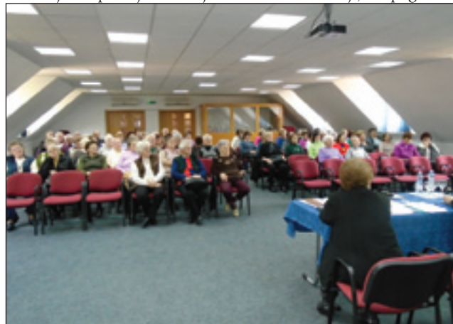
Na občni zbor je prišlo 75 členov

14 mali programov nej tak postavila vküp, kak je tau zvekšoga šega, ka se ta povej, ka vse so meli. Najprvim je ta prajla, kak se je sprmejnila numera penzionistov v pet lejtaj, zakoj je tak pa ka se leko čaka po tejm, ka leko dejemo pri tejm. Po tejm