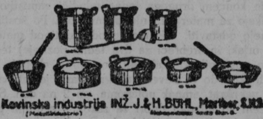
Kuhinjska industrija INŽ. J. & H. BURL, Maribor, S. J.

Ta garnitura kuhinjske posode je iz najboljšega aluminija; snežno bela in desetletja trpežna. Dobavlja se proti predplačilu ali povzetju.