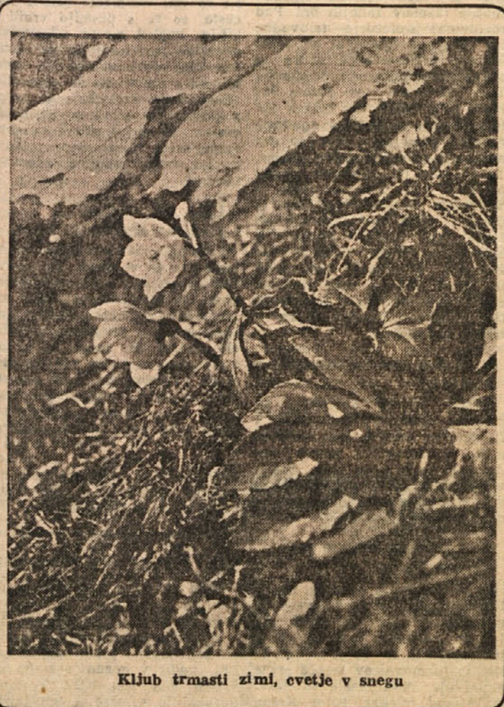
Kljub trmasti zimi, cvetje v snegu

Na Daljnem vzhodu pa je še vedno v ospredju Formozo, čeprav trenutno ni toliko o njej slišati. Nekateri dogodki so pokazali da so ZDA stopile korak nazaj, to je, da so se nekoliko približale britanskemu stališču, ki se močno ujema z indijskim. Britancji so za prepustitev otokov Kvevoj in Macu Kitajcem, Američani pa postavljajo pogoje. Tako je Dulles izjavil, da ZDA ne bodo branile teh otokov, če bo šlo za lokalno akcijo, za priključitev in nič več. Če pa naj bi postala ta dva otoka odskočni deski za napad na Formozo, bodo stopile ZDA v akcijo. Začasna rešitev formoske krize toroj ni nedosegljiva.