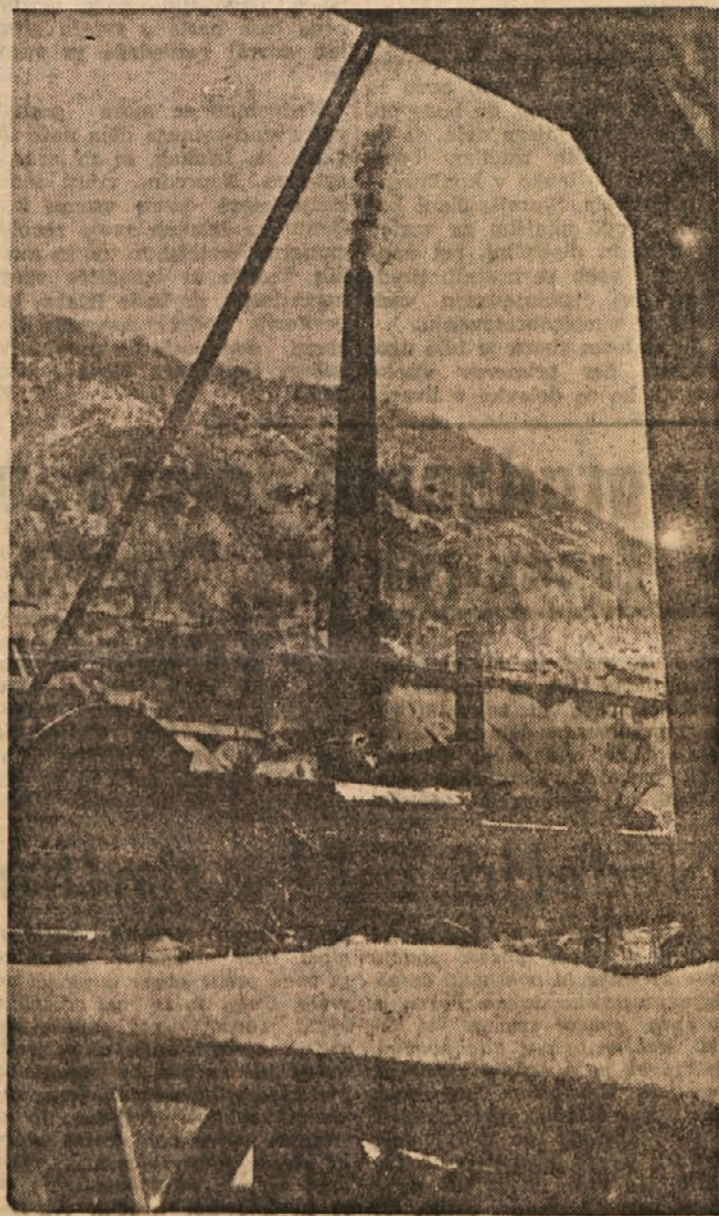
Pogled na Elektrarno Trbovlje

— V Beogradu so osnovali vezno komisijo za proučevanje proizvodnosti dela. Ena najvažnejših nalog komisije bo da bo še letos izdelala znanstveno metodologijo za merjenje proizvodnosti dela v našem gospodarstvu.