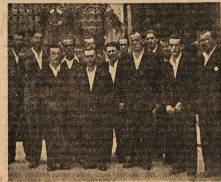
Prvi upravni odbor Steklarne-Hrastnik

Lepo in prijetno je poslušati vesele in poskočne doma na toplem. Plačaj naročnino „Zasavskega vestnika“ za celo leto, pa bo verjetno radijski aparat — tvoj.