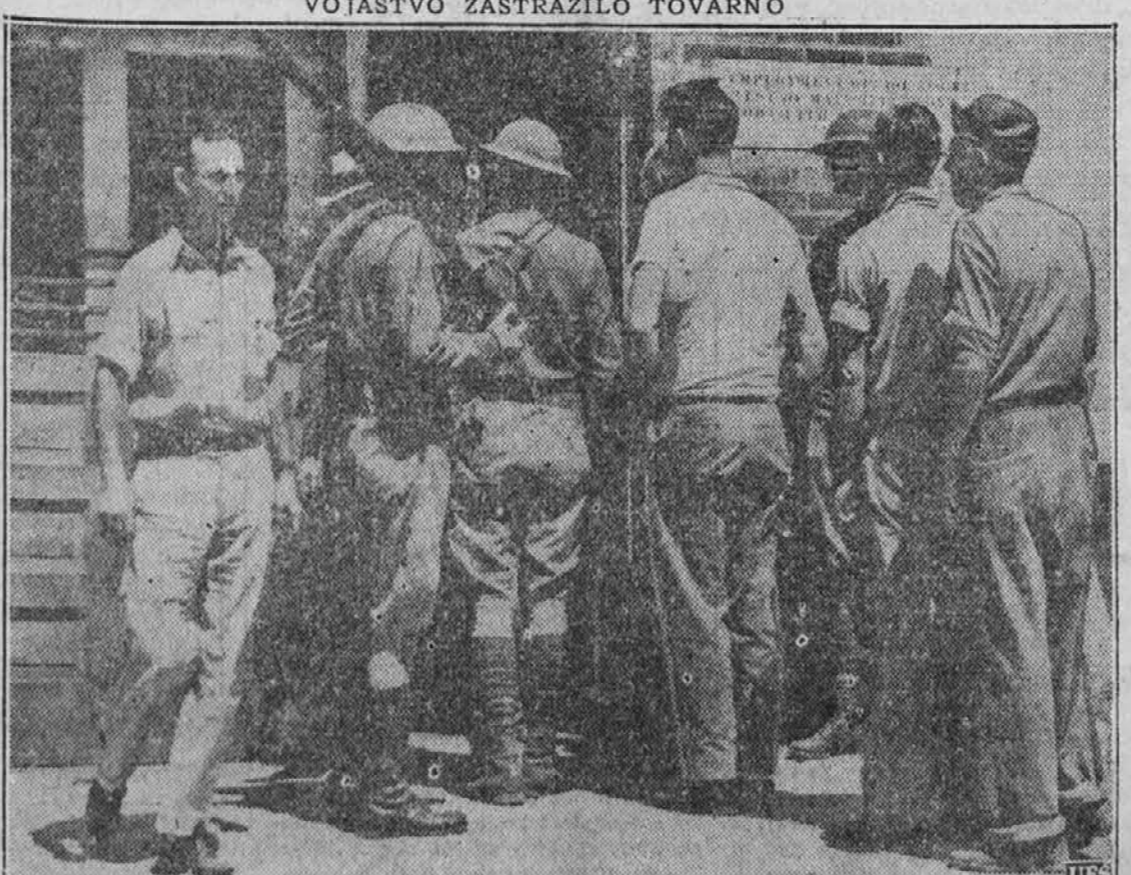
Pod stražo državnih miličarjev se je delavstvo nedavno povrnilo na svoja mesta v Maytag tovarni v Newton, Ia., po stavki, ki je trajala okrog deset tednov. Voditelji unije pa so povdarili, da se borba za pravice delavstva v tej tovarni še ni nehala, in se je torej tovarna odprla le pod oboroženim pritiskom.