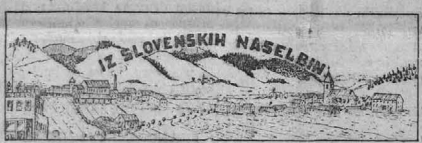
IZ SLOVENSKIH NASELJIN