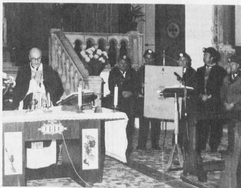
En moment lietošnje svete Barbare: sveta maša v špietarski cirkvi

Nekateri od nas smo se srečali z njo, se poguoril an spominjali na tiste čase, kar mi smo bli otroc an ona naša meštra.