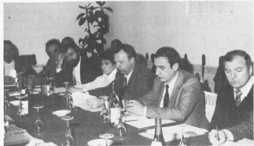
En del prisotnih na kongresu ZSI

tu in ki šele poznajo naš izik, poznajo slovenščino in tudi italijanščino. Sada mi potrebujemo vključiti v našo Zvezo tudi nove generacije, tiste ki imajo sedaj okoli 20 let, ki jutri bojo naši kadri po svetu in tudi bi mogli na kak način pomagati za razvoj Benečije, ker naši izseljenci tudi po svetu so paršil na tak livei. Mladina je bila do sada puščena no malo recimo par kraju, ker naše delo Zveze je bilo buj za rudarje, za tele stare, za penzione, za tele socialne probleme. Do sada nismo še ušafali no politiko za te mlade, mamu pripravt de se bojo interešal tudi te mladi tu našo Zvezo in v telim občnem zboru bi radi skupaj z vsiem delegatam rešili tel problem. V telim občnem zboru bo prvič vič judi, ki so paršli iz Amerike, iz Kanade, iz Belgije in tudi iz Italije. Ta zunaj, uoz dežele Furlanije bojo večina, ker do sada so bili večina skor nimar tisti, ki so tle v Čedadu in tako de bomo lahko poslušali; kaki so problemi od tih mladih zunaj in tudi smo povabili no malo od telih mladih, de sami bojo povedali, kaj potrebujejo v vsaki arei, ker težave, ki imajo v Belgiji, ki imajo v Švici so diferent ku kar imajo v Ameriki in v Avstraliji. Tisti iz Evrope imajo šele direktne kontakte z Benečijo, hodijo enkrat, dvakrat, še trikrat na leto v Benečijo. Iz Argentine je zelo težko tudi zaradi ekonomske situacije, ki imajo v južni Ameriki.