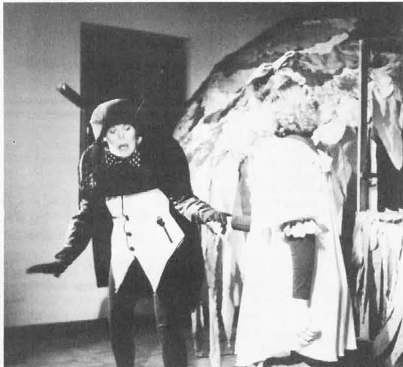
Posnetek z igre Ole luk