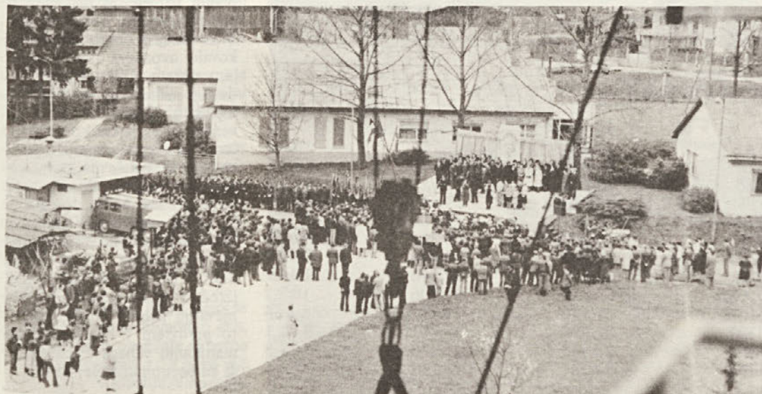
S PRVOMAJSKE PROSLAVE

Pri realizaciji plana proizvodnje v TOZD Lipa ni bilo posebnih bistvenih težav, ki bi posebno ovirale TOZD pri uresničevanju sprejetih nalog. No, seveda ni šlo vse tako gladko. V februarju se je pojavilo pomanjkanje žaganega lesa, kar se je v marcu popravilo (večje dobave iz TOZD Žage Soteska). Ostale težave, ki pa niso kratkotrajnega značaja, so: pomanjkanje skladiščnih površin, saj morajo gotove izdelke večkrat prelagati, ko jih razvažajo po zasebnih skladiščih, ki jih imajo v najemu. Močna ovira pri manipulaciji je tudi dejstvo, da nimajo viličarja, ki bi veliko pripomogel k zmanjšanju porabe časa pri transportu in humanizaciji dela.