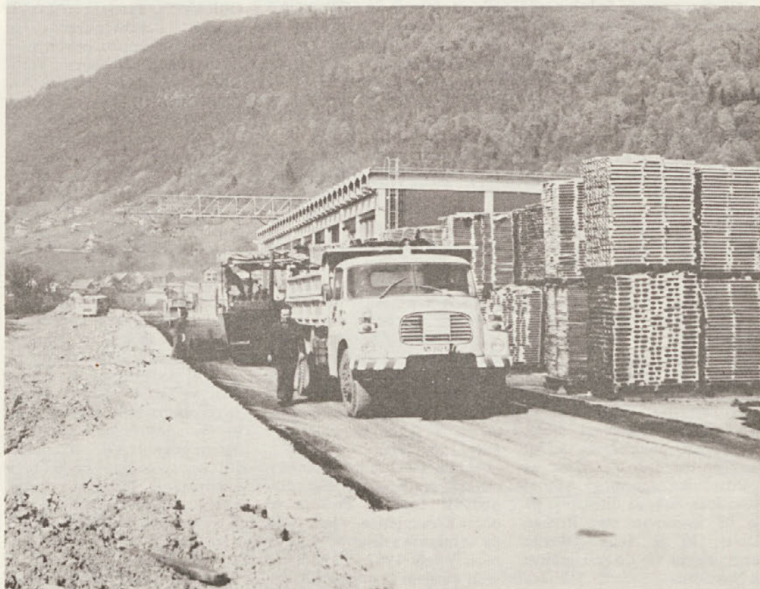
PRI DECIMIRNICI TOZD ŽAGA SO POVEČALI ASFALTNE POVRŠINE