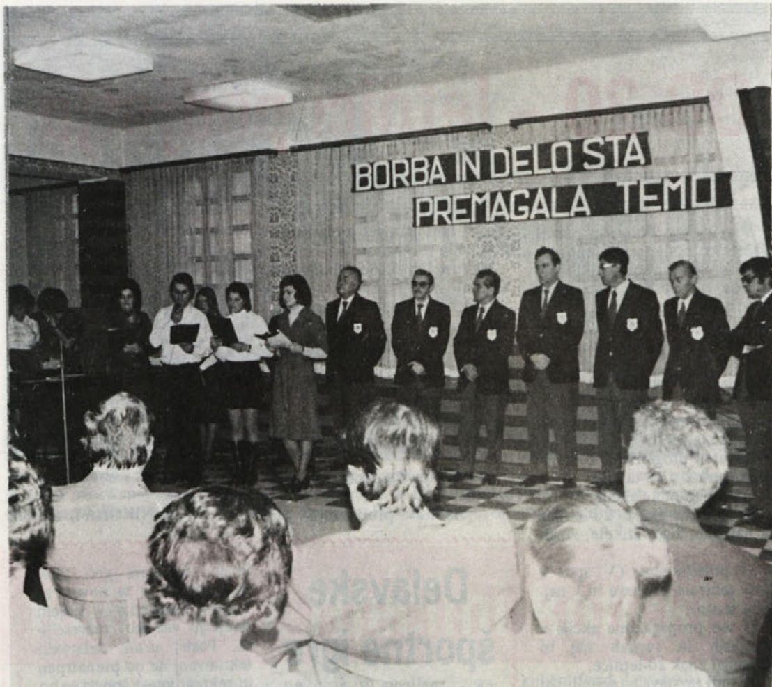
Ob podelitvi priznanj in nagrad jubilantom dela je bil pripravljen tudi krajši kulturni program. Z recitacijami so nastopili mladinci iz Beti, Karlovački oktet pa je zapel nekaj pesmi.