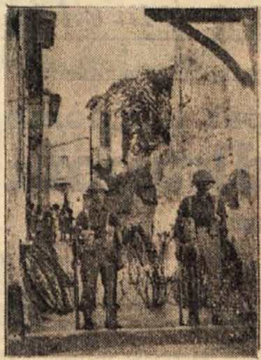
Britanske čete na Cipru

V Limasolu je bil neki deček smrtno ranjen v hipu, ko so britanske čete streljale na demonstrante, da bi jih razgnale. Demonstrirali so proti uvedbi policijskega časa.