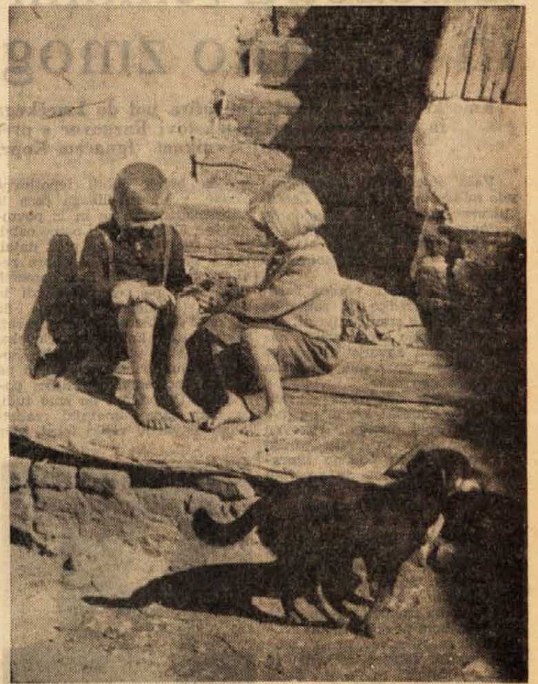
Bratec in sestra na stopnicah pred domačijo

Nespretni tiger ni mogel priti do besede. Podvil je rep med noge in zbežal v gozd. Verjel je, da je lisica zares strašna zver.