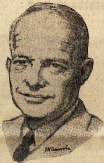
rali njegovim zdravnikom optimizem.

Zato izraža izredni padeč tečajev na newyorški borzi predvsem opreznost poslovnih krogov, ki ča, akjo, kakšen bo izid tega boja za