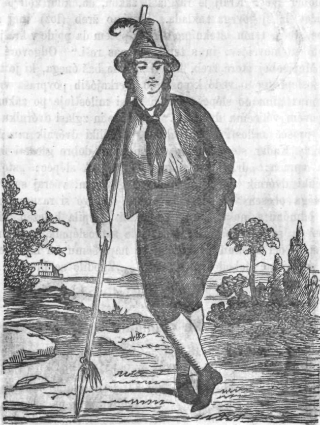
Planinski prebivalec v Tirolah.

Krave veselo mukajóč, zbirajo se in veselo poskakujejo. Največjeje in najlepše kravi, ki je vsej čredi vodnica, obesijo okoli vratú ta zvonec na lepem traku, in med roge se jej priveže šop cvetja. Tudi druge krave dobre zvonce, nekatere večje, nekatere manjše, in pastir pazi posebno na to, da se glasovi lepo vjemajo. Pervi pred čredo gre pastir, ves okinčan s cvetjem in pisanimi verbcami, takój za njim gre krava vodnica, potem druge krave, v sredi med njimi gre bik, kateremu med roge privežejo s pisanimi verbcami in cvetjem okinčan jednonóžen molzen stolček, na katerem možič ali molzica sedi, kadar molze. Za čredo gre drugi pastir in jeden hlapec, ki nese molzno posodo. Vso drugo pripravo, ki je na planinah potrebna, recimo: posode za