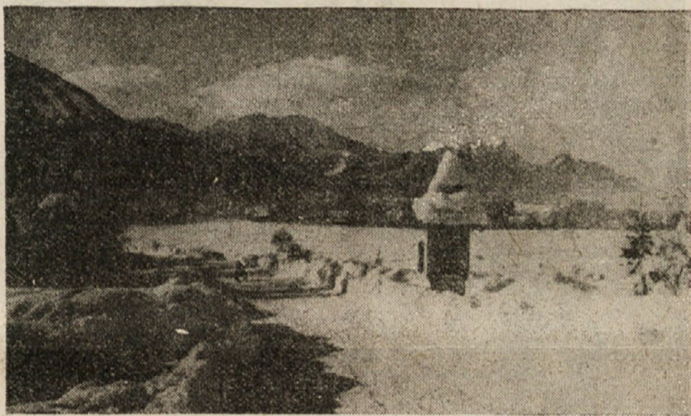
Na polju znamenje stoji...

Trije so sedeli v sobi. Na nizkem čevlarskem stolcu starel s suhim, rumenim obrazom, obrit, z redkimi, na pol osivelimi lasmi, ki me je, ko sem vstopil, pogledal z bolj žalostnimi kakor začudenimi očmi. Odzdravil je na moj pozdrav ne neprijazno, a silno trudno. Ko sem mu povedal, česa bi ga prosil, je počasi zmajeval z glavo in spet trudno govoril: