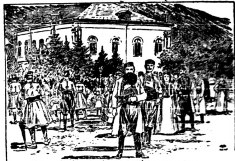
Vor dem fürstlichen Palais nach der Königsproklamation in Cetinje

Poročali smo že, da so se vršile te dni v Cetinju velike slavnosti. Kneza Nikito so namreč kraljem proglasili. Naša slika kaže pogled na kraljevo palačo neposredno po tej slavnosti. V ospredju vidimo krepke črnogorske postave Sproglasitvijo Črnogore za kraljevino seveda Srbi niso zadovoljni, ker so hoteli biti voditelji na Balkanu. Ravzen monakoveškega kneza imamo zdaj v Evropi same kralje in cesarje. Pusbnega političnega pomena take komedije balkanskih „Zaunkönigov“ seveda nimajo.