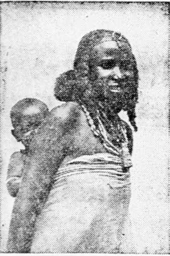
Mlada abesinska mati

meje je povedal, da ta dan ne bo letala za Addis Abebo. Na povračilo zaradi izgube časa ne more popotnik niti misliti. Pre-nočišče in hrano v hotelu v Asmari sva morala seveda plačati iz svojega žepa. Letala ni, čeprav bi moralo priti. Kaj hočeš? Peš ni mogoče priti v Addis Abebo. Cariniki so do dobra premetali najine kovčke. Dolgo sva se nekaj iskali, dokler niso pokazali s prstom na zlate ure. Gromko sva se zasmejala, toda asmarski cariniki so se čutili na vso moč užaljene, da se kdo upa podcenjevati njihovo službo. Spomnila sva se na Ruše in njihove čašice.