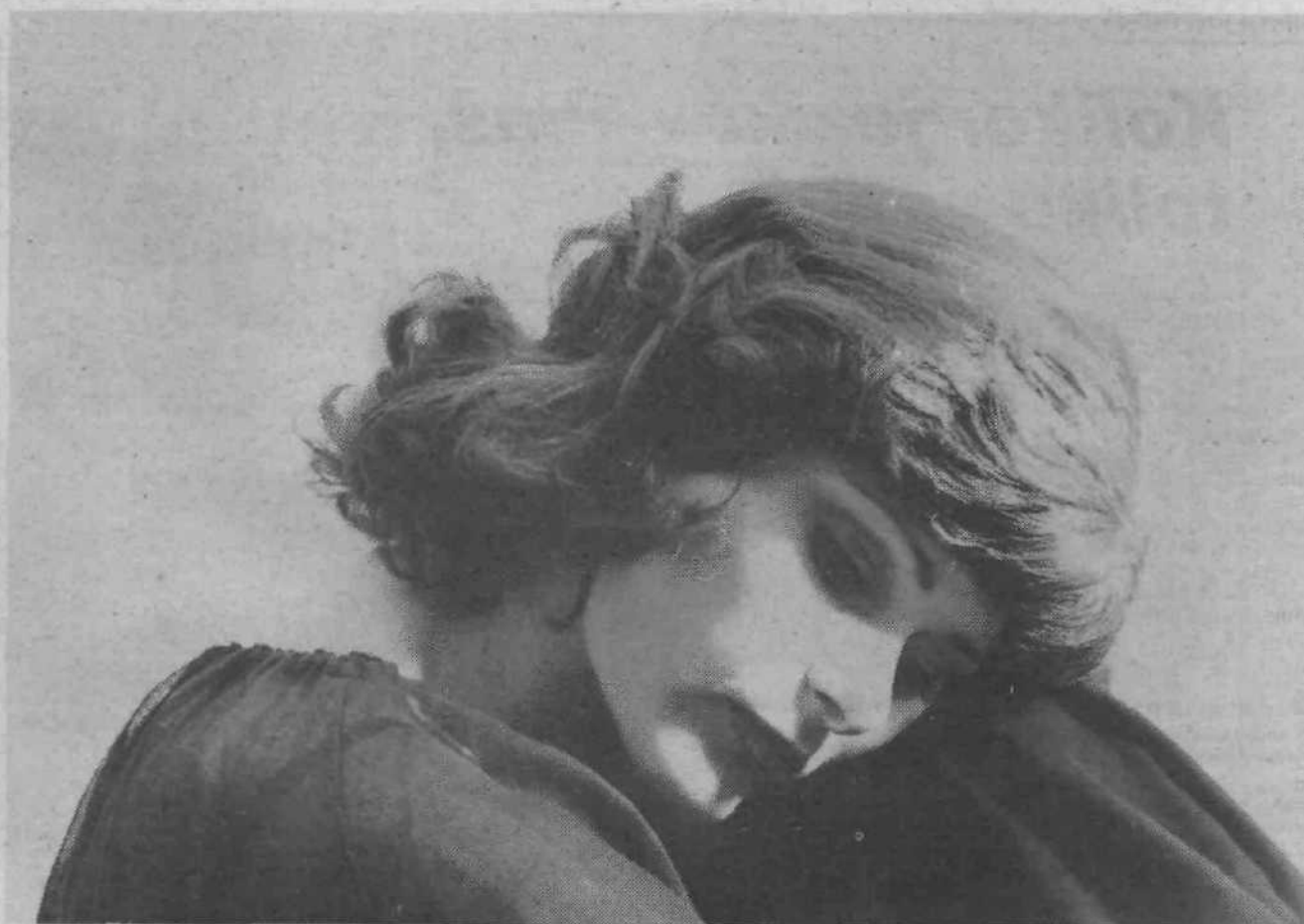
Lepa in osamljena – paradoks, ki pesti današnjega človeka