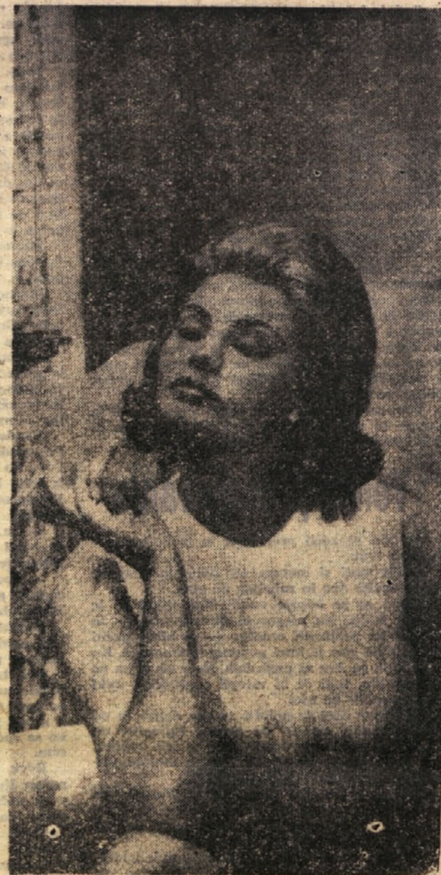
IZ ALBUMA FILMSKIH IGRALC: Sophia Loren

Vozila sva se torej za njim. Bena sem razločno spoznal tudi s hrbita. Ni bilo dvoma, da je bil on. Ta podolgovata