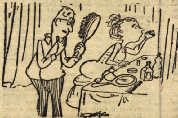
— Hm, moral se bom obriti!

televizorjev in je tako nedvomno prekosila Veliko Britanijo, ki jih ima 12,5 milijona. Zahodna Nemčija je na četrtem mestu z 8 milijoni,