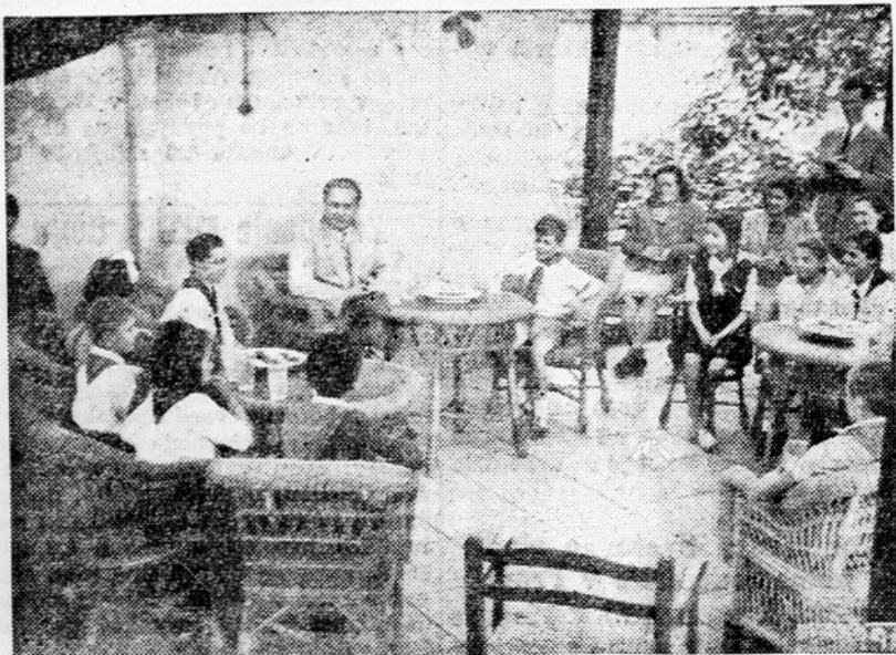
Predsednik vlade FLRJ maršal Josip Broz Tito je sprejel v soboto popoldne predstavnike beograjskih pionirjev, ki so ga prišli pozdraviti pred otvoritvijo »Otroškega tedna« in mu prinesli darove.

Slovenska prosvetna zveza za Slovensko Koroško izrekva v imenu vseh udeležencev turneje vam in vsej svobodni domovini zahvalo za veličasten sprejem, gostoljubnost in bogata darila. Turneja nam bo nova vzpodbuda v hodi za pravico in svobodo.