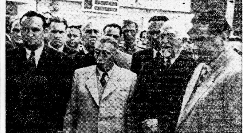
Dr. Vladimir Bakarič, Moša Pijade, Vladimir Nazor in Boris Kidrič ob otvoritvi zagrebskega veleposla.