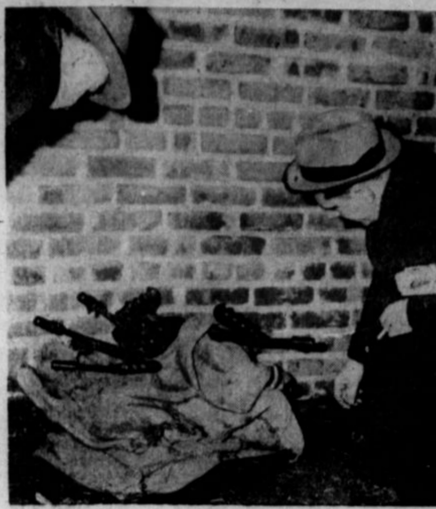
V newyoriki luki se dogaja, da orožje, namenjeno Angliji, "neznano kam izgine". Gornja slika predstavlja, ko so detektivi nekaj ukradenih strojnih pušk izsledili. Vzeli so jih "petokolonci", ali pa kaki drugi sovražniki Anglije.