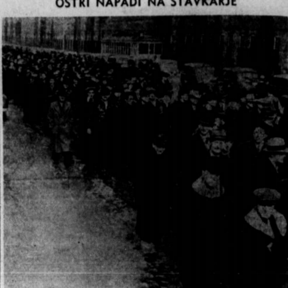
Valed oboroževanja v velikem je industrija mahoma zavalovela po vsi deželi. Tako se je postril tudi boj med delom in kapitalom. Članek o tem je na tej strani v zadnjima dvema kolonama. Na gornji sliki je skupina delavcev Allis-Chalmers korporacije v Milwaukeeju, ko demonstrirajo v prid svojih zahtev. Ko to tiskamo, traja stavka že blizu dva meseca.

Število naprednih delavcev med našim ljudstvom, ki so svoj čas in sposobnosti posvetili na-