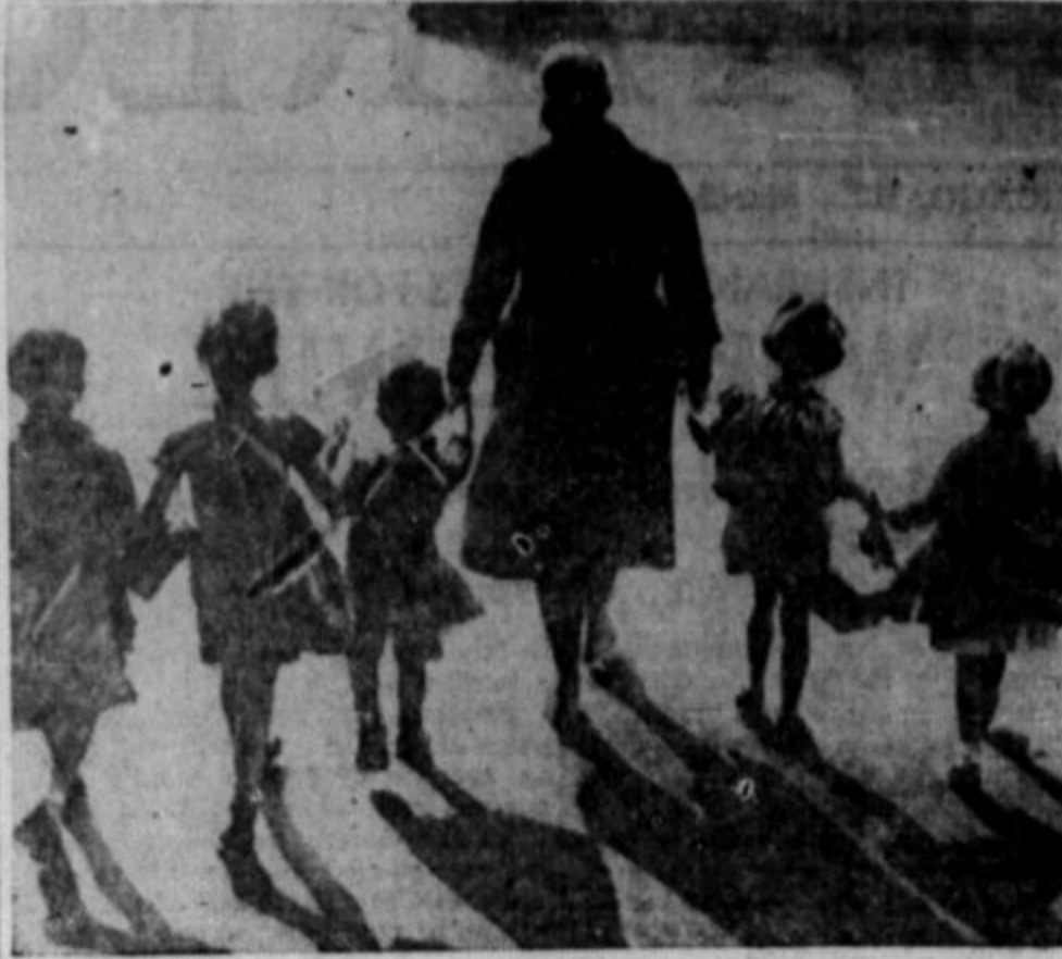
Iz vseh mest v Angliji so spravili na deželo stotine otrok, kar pa je ustvarilo nove probleme, na primer vprašanje, kdo jih naj preživlja, in na katere stroške se naj zdravijo v bolnišnicah. Tisoče in tisoče družin je prizadetih, ker so vsled "totalitarne vojne" vrzene popolnoma iz reda. Na slikah je voditeljica skupine otrok v Angliji, ki so skušajo oteti nemških letalcev z begom v varnejše kraje, kakor pa so velika mesta. Vsi so opremljeni s plinčnimi maskami in drugimi zasilnimi pripomočki.

hlapečevstvo ali tlačanstvo je odpravljeno. Pridobljena je civilna, osebna in verska svoboda. Človeku je dano izbirati po lastni volji delo in delodajalca. Nič mu ne more več vsiliti te ali one vere. Temu je v bistvu tako. Ali okolščine, ki jih astvarjajo razni nedostatki modernih demokracij, zelo omejujejo tisto svobodo.