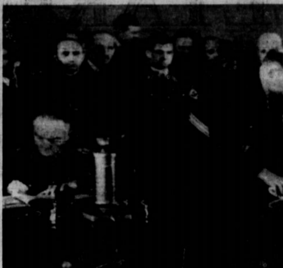
V Rumuniji je sedaj nad pol milijona nemških vojakov, kar pomeni, da je poleg njih tudi vojnega mehanizma več, kot pa je v starih časih vojevanja pomenilo milijon vojakov. Hitler si je Rumunijo osvojil za svojo glavno stopnico pridiranja iz Nemčije na Balkan in dalje v Azijo in Afriko. Na sliki je rumunski "diktator" general Ion Antonescu (na levi) in pa nemški ter rumunski predstavniki "novega reda" za "nemški življenjski prostor."

Ta neodločnost, to pomehkuženje buržvaznih in delavskih strank je morala prinesiti posledice, kakršne so. Padla je mala antanta, padla zveza sporazuma škandinavskih dežel, balkanska zveza in liga narodov.