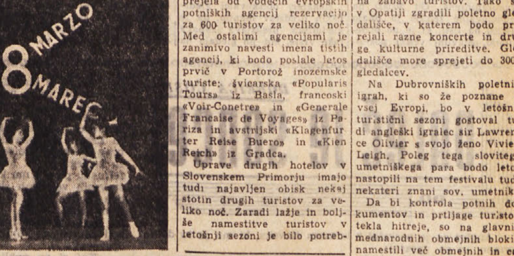
Včeraj smo ostali na dolgu, ker nam prostor ni dopustal, da bi objavili več slik z nedejske proslave mednarodnega praznika žena v dvoranah na stadionu «Prvi maj». Tu objavljamo še (zgornj) gojenke baletne šole SNG, plesno skupino iz Brega in dolinski kvartet z duetom med izvajanjem svojih točk

Zanimanje tujih turistov za Jugoslavijo se večja iz dneva v dan. V nekaterih mestih južne Dalmacije pričakujejo pridoj prvih letošnjih turistov že prvih koncu tega meseca. Posebno zanimanje kažejo domači in tuji turisti za slovensko obalo. Uprave posameznih hotelov v Portorožu, Piranu, Ploju, Kopru in Ankaranu so sklenile do danes že več ugodnih dogovorov z različnimi evropskimi potniškimi agencijami. Zanimanje za biser severnega Jadrana. Portorož, je večje kakor kdaj koli do sedaj. Prvi letošnji turisti bodo dospeli v Portorož v začetku prihodnjega meseca. Takojšnji hoteli so pripravljani, da jih sprejmejo na vzoren način, kakor so to delali tudi do sedaj. Določene skupine tujih gostov so najavile svoj pridoj v Portorož za velikonočne praznike. Posamezne skupine teh turistov se bodo zadržale pet, druge dva, samo uprava hotela «Palace» v Portorožu je že prejela od vodečih evropskih potniških agencij rezervacijo za 800 turistov za veliko noč. Med ostalimi agencijami je zanimivo navesti imena tistih, ki bodo poslale letos prvi v Portorož inozemske turistične agencije: švicarska «Populair Tourist», avstrijska «Voyagers», francoska «Voyages», italijanska «Generalis», avstrijska «Klagenfurt Reise Bueros» in «Kien Reich» iz Gradača. Uprave drugih hotelov v Slovenskem Primorju imajo tudi najavljene obisk nekaj stotin drugih turistov za veliko noč. Zaradi lažje in boljše namestitve turistov v letošnji sezoni je bilo potreb-