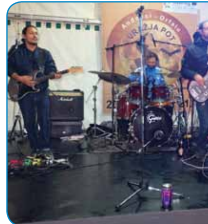
Pohodnike je zabavo ansambl

ta bitja (lények), stero mo na pauti srečali, so en tau naše slovenske (nesnovne) kulturne dediščine. Potejm je pa staupo na čelo pohoda pa nas je pelo po pauti, stera je bila kauli 4 kilometre duga. Po parstau metraj smo na medjej šonžeta pa gauške zaglednili iskrice pa male plamenčke, steri so es pa ta skakali. Tau so prej dūše tisti merarov (inženirjev), steri so nej dobro zmejriji meje med njivami, za-