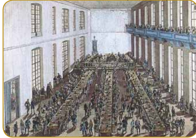
Stanovski zbor so krali do leta 1848 vküppazovali v Požonji (Bratislavi)

Gda so francuskoga impera- tora dojspotrli, se je v habs- burškoj monarhiji začno