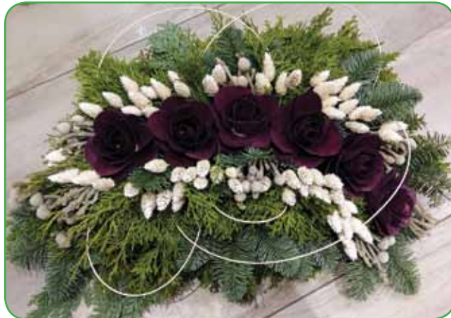
Suho sveži aranžma za grob

zalivati, ker hitro ovenejo, hkrati pa je voda v okrasnem lončku lahko usodna