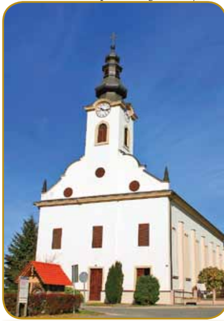
Evangeličanska cerkev v Bodonci gnes - leta 1792 so bogoslñžja začnili držati v ednom škednji

škoma cesari, šteri je zatok vküppauzvo vogrsko-rovač- ki djilejš. Tam se je Madža- rom eške itak nej prišikalo nutvpelati vogrsko rejč kak