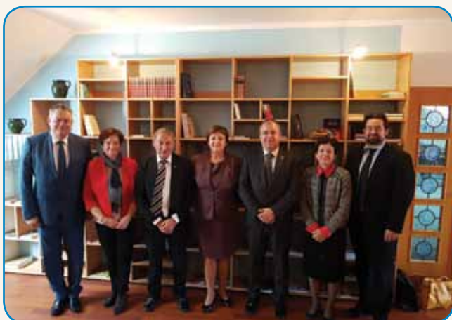
DVODNEVNI URADNI OBISK DRŽAVNOZBORSKE ... stran 4