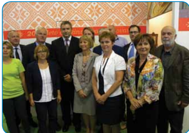
Člani Agroslomaka s kmetijskim ministrom Dejanom Židanom na Agri-mednarodnem kmetijskem sejmu v Gornji Radgoni