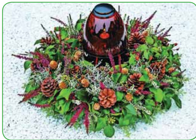
Venček s svečo je najpogostejša oblika za grob; okrogla oblika simbolizira večnost, neskončnost - prehajanje iz enega v drugo življenje

Vse bolj so priljubljeni suho sveži aranžmaji. Ostanajo