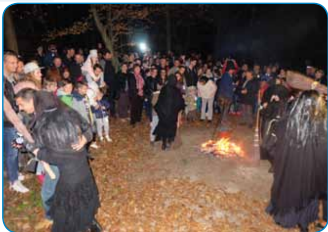
Množica v andovski gauški

opirati grobauvge, iz nji pa naprej prišli mrtvecke. Kak je Karči Holec pripovejdo, lidgé so se vsigdar batrivne (pogumne) delali, ka se oni prej ne bojijo. Gnak je v ednoj vesi se eden moški prej stavo s padaši v krčmej, ka z graubišča križ prinese v krčmau. Tak je napravo pa daubo par litrov