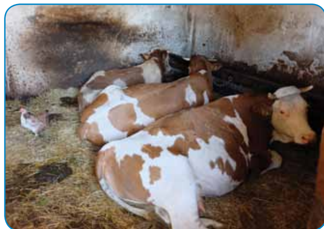
V štali majo eške sedem glav živine

štirinajset bilau, smo v gauštjo šli, zato ka ovak je tam v grabi vsigdar meko pa ovak tam ne moreš vöpridti. Gda smo se kreda dejvali, je edna medicinska sestra prišla pa pravla, kama deva, gda je tak mrzlo. Kak bi bilau mrz-