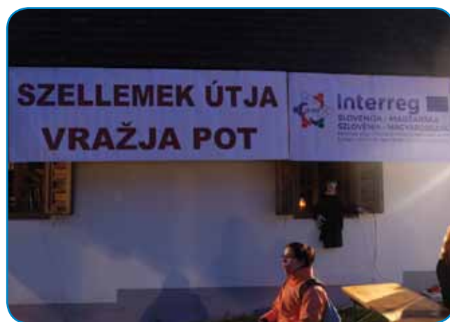
Nočni pohod se je organizero v okiri projekta »POBEG IZ ZGODOVINE V PRIHODNOST – PO POTI STRPNOSTI«

Dapa mi smo nej mogli vöokrauziti čaralice, stero so gostüvanje mele. Na srejni pauti so v kotli fejest küjale pa kauli ognja plesale. O čaralica je dosti zgodb v porabskom ljudskom verovanji. One so prej moške, sploj pa tiste, steri so ponauči ojdli, zapelale, ka so cejlo nauč mogli z njimi plesati. Zdaj so ništrne pohodnike tö zgrabile, dapa zatok njim