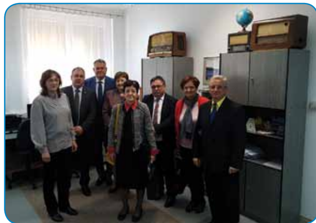
Na obisku v slovenskem radiu v Monoštru

Komisija za odnose s Slovenci v zamejstvu in po svetu je svoj dvodnevni uradni obisk na Madžarskem 13. oktobra nadaljevala v Slovenskem Porabju. V okviru programa so