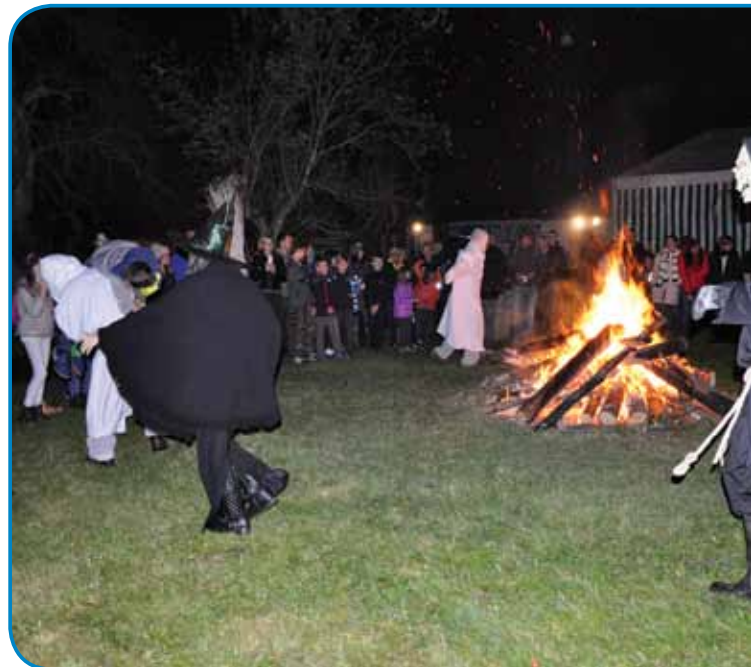
Tak so plesale čaralice kauli ognja

steri je zvün toga, ka je na kratko gunčo od projekta, je pohodnikom tapravo, ka vsa