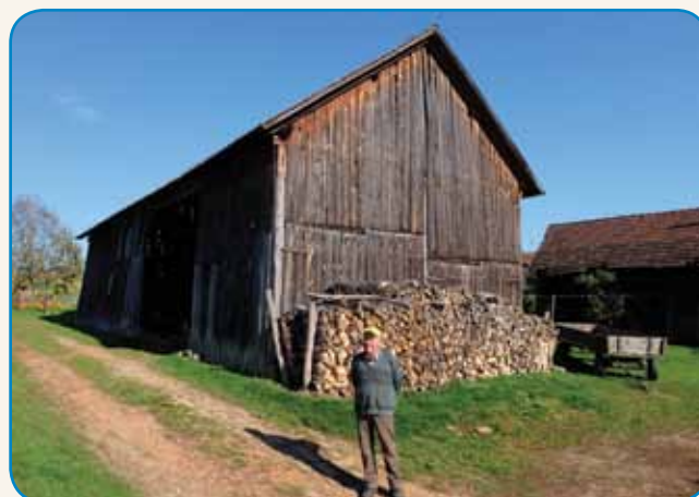
ČASA TELKO MAŠ, KELKO SI GA VZEMEŠ stran 8