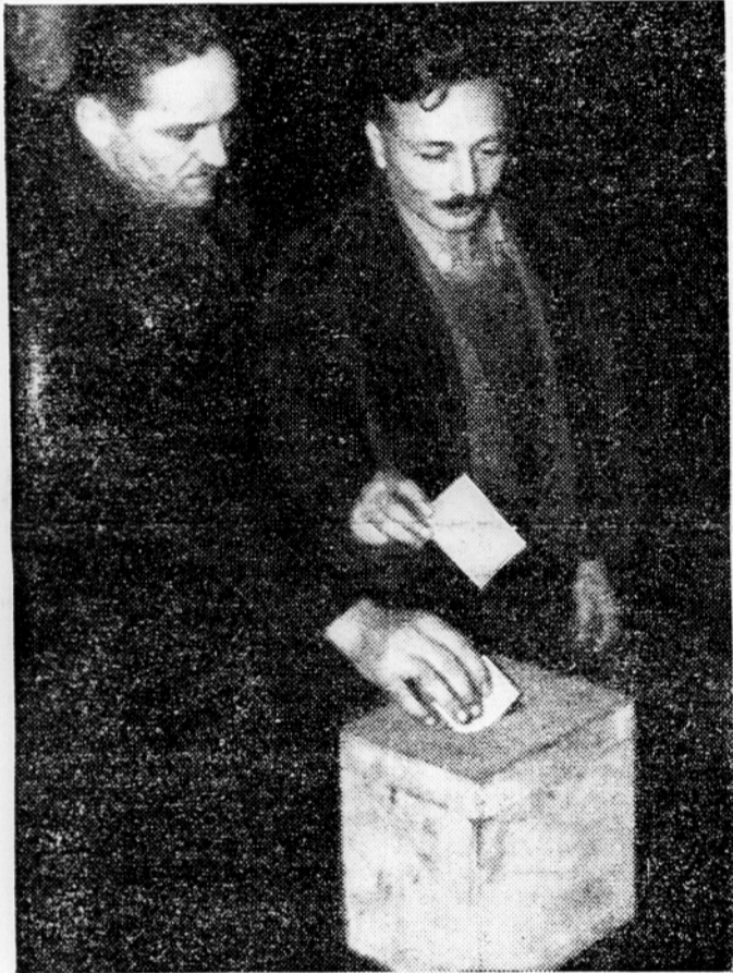
Na volišču v železniški kurilnici

Beograd, 2. decembra. Združenje univerzitetnih profesorjev in drugih znanstvenih delavcev iz Beograda je poslalo naslednji protest generalni konferenci UNESCO v Parizu: »Zavedajoč se trpljenja jugoslovanskih narodov v boju proti fašizmu in jugoslovanskih žrtve v borbi proti Franciji, globoko vdani naprednim silam človeštva in prepričani, da nobene politične kombinacije ne opravljajo, da bi stopali z roko v roki z ubijalci, — obojamo sprejem Francove Španije v UNESCO kot enega izmed najbolj nemoralnih dejanj, ki se je kdaj koli pripetilo v mednarodnem življenju.«