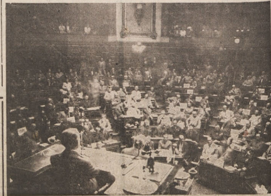
Prizora z zasedanja Združenih narodov: Pogled na plenarno zasedanje 21 držav, zmagovalk v protifašistični vojni.

Razprave in sklepi na mirovni konferenci v Parizu in v organizaciji Združenih narodov so le dokaz, da boj za zmago demokracije ni še končan. Fašizem je bil pobit na bojnem polju. Toda razlogi, ki so dali fašizmu življenje, so še vedno tu in delujejo dalje. Vse to nam priča, da morajo ostati demokratični narodi budno na straži, da se ne smejo zadovoljiti z doseženimi uspehi, da se ne smejo boriti le proti ostankom fašizma, marveč da morajo tudi uniče-