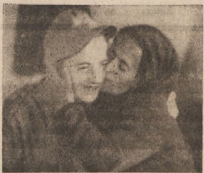
Albanski partizan se je vrnil k svoji materi

Svojo zahtevo po južni Albaniji utemeljujejo monarhofašisti s tem da, je