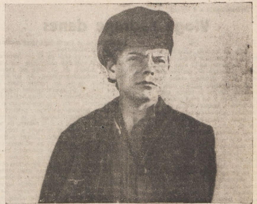
Mladost Maksima Gorkega.

Tako je stari mojster zaključil svojo zgodbo, ogenj dogoreva, na baržunasti temi-