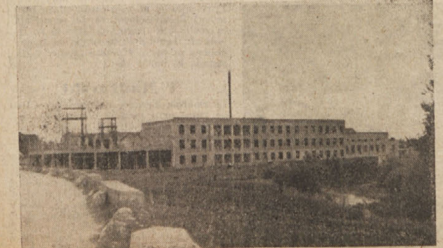
Na Vrhniki so zveste delavske roke zgradile veliko tovarno usnja

Grgarski okraj je bil z glavno prometno cesto slabo povezan, ker je z demarkacijsko črto pripadala glavna cesta v Grgar, pod cono A. Naša mladina pa je pričela z gradnjo te ceste pod geslom: Nobena demarkacijska črta, nobena francoska linija nas ne more ločiti in razkosati, mi si gradimo ceste in ustvarjamo boljše življenje sami s svojimi delovnimi rokami in delavsko zavestjo.