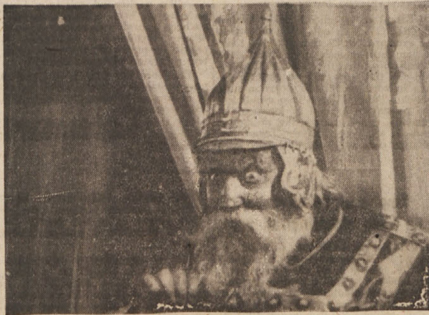
Igralec Potemkin v vlogi »General« v sovjetski filmski pravljici: »Na ščukino zapoved«.

Znan film je »Lenin oktobra 1918.«, ki prikazuje nesmrtnega voditelja boljševikov v dobi ko se je sovjetska oblast utrjevala. Film prikazuje vso veličino genialnega Lenina, ki je vodil nekdanj prejšnjepredrevolucije ljudske množice v zmagoslavni pohod proti izkoriščevalcem. V filmu »Mi iz Kronštata« se pa prikazuje brezmejna požrtvovalnost in globoka moralna zavest rdečih mornarjev, ki se točjejo z belogardisti v okolici Petrograda, ki se točjejo do poslednjega diha in umirajo za velike ideje, ki jih je got glesla nosila velika oktobrsko revolucija in ki kot taka pomeni narodom Sovjetske zveze prebujenje in preorenje v svet enakopravnosti, svobode,