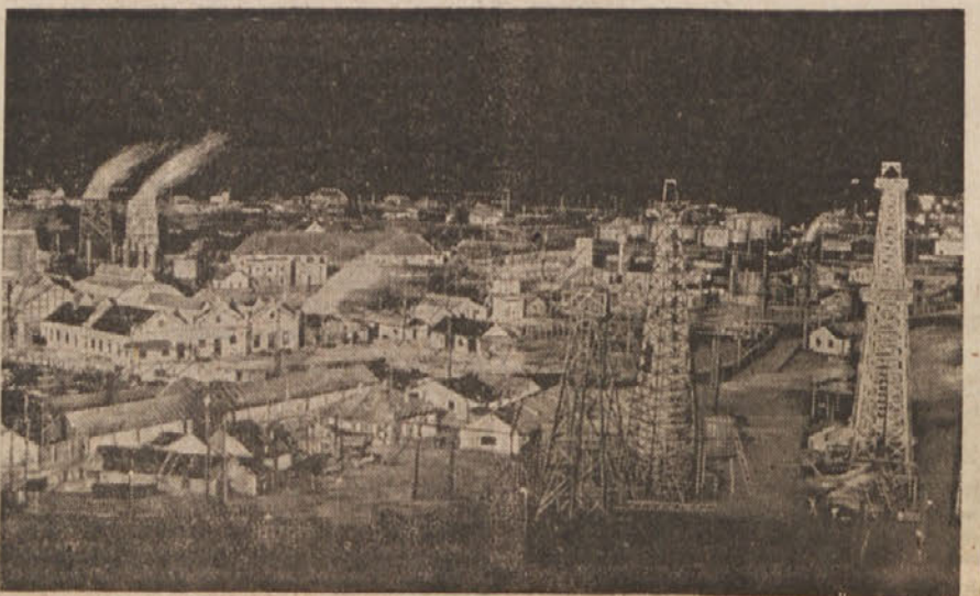
Romunski pe trolejski vreli

lepe uspehe. Lani je bilo posejane tri milijone ha zemlje, kar pomeni 900.000 ha več nego predlanski. Proizvodnja nafte se je povečala za 1.200.000 ton. Uvoz surovin iz Sovjetske zveze je omogočil obnovo tekstilne industrije. Prav tako je narasla proizvodnja premoga. Brezposelnost se je zmanjšala in življenjski pogoji množic so se izboljšali. Temu delu ni moglo do živga nobena sabotaža v vrstah zgodovinskih strank, ki imajo zlasti