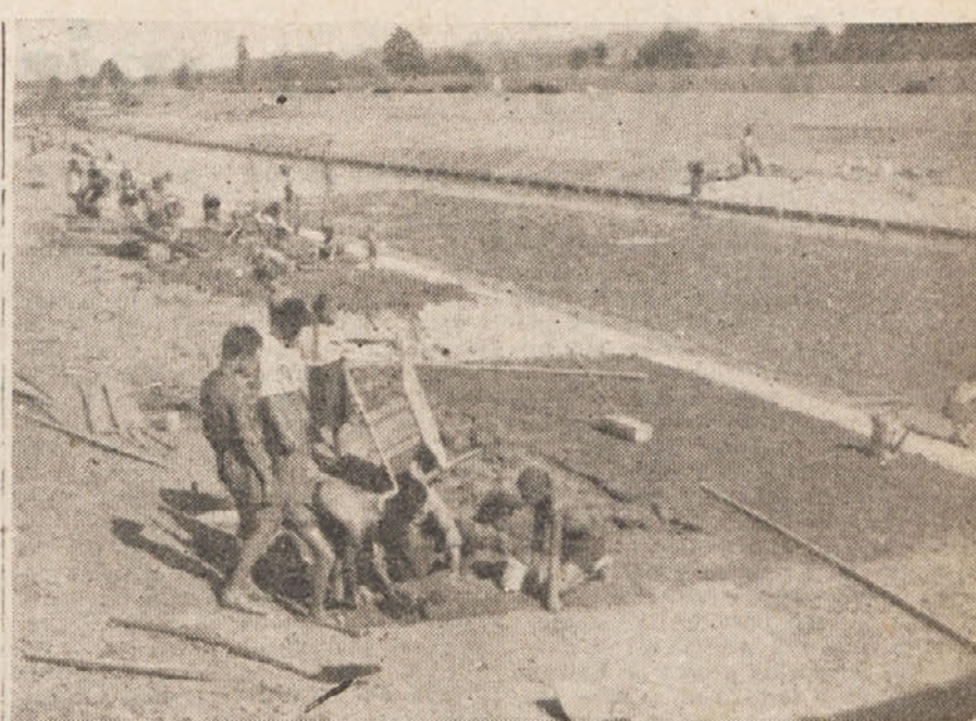
Pesnico regulirajo. Vsa dela je izvršila izključno mladina

si za mesec julij priborili proletarsko prehodno zastavo. Tako so si s požrtvovalnim delom priborili še naslov najboljše delovnega kolektiva Slovenije. Jeklarja je dosegla največjo proizvodnjo in je tudi največ prihranila na materialu. Drugi oddelki spet prednjačijo po največjem številu udarniških ur, po najboljši oceni v delovni disciplini. Delavci so vsi organizirani v Enotnih sindikatih in se pridno udeležujejo na prosvetnem in na fizikalnem polju. Omeniti je treba, da jeseniški kovinarji poleg svojega naporega dela v železarni žrtvujejo mesečno 450.000 din za gospodarsko in socialno obnovo okraja. Uspeh jeseniških kovinarjev je za nas tem pomembnejši, ker je njihovo delo ena najosnovnejših industrijskih panog za uspešno obnovo naše skupne države Jugoslavije. Pomen njihovega uspeha pa ni samo v tem, da so dvignili proizvodnjo, ampak tudi v tem, da so hkrati dali zgled ostalim tovarštem po Sloveniji in tako prispevali k splošnemu dvigu delovnega poleta.