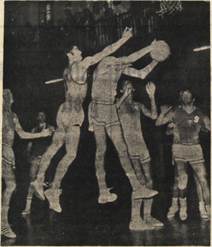
Borovi kosarkarji bodo imeli v D ligi jutri težko nalogo, kot so jo imeli tudi pretekli teden, ko so nastopili proti Castellarcu Venetu (na sliki)

Jutri, ob 9. uri se bo na stadionu na Rojčah začel drugi del atletskega tekmovalca v okviru občinskih mladinskih iger. Tokrat bo na sporedu za dečke: tek na 80 m, tek na 2.000 m, skok v višino in daljino, met štirikilogram-..."