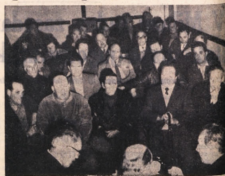
Predvečerašnjim je bil v dvorani prosvetnega društva na Proseku stanek, ki ga je sklical pripravljalni odbor za postavitev spomenika padlim, ki so se ga udeležili mnogi bivši partizanski borci