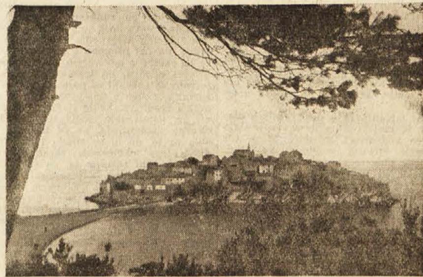
Sv. Stefan v črnogorskem Primorju.

Budva je majhno mestce z ozkimi, senčnimi ulicami, okrog in okrog obzidano. Človek bi rekel: otroci so se igrali, pa so sezidali to malo igračko.