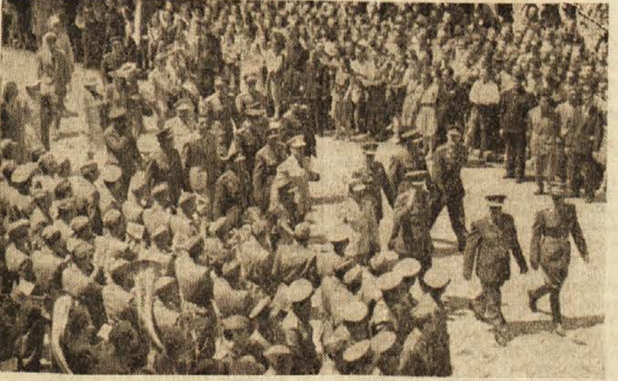
Množica je navdušeno pozdravila bratsko češkoslovaško delegacijo pred Domom armije.

Potemtakem na grški strani ni moglo biti nobene pomote. To je ugotovila tudi strokovna komisija na terenu. To pa je tudi povsem jasno ljudstvu v tem kraju, ki dobro pozna provokatorske metode grške monarhofašistične vlade.