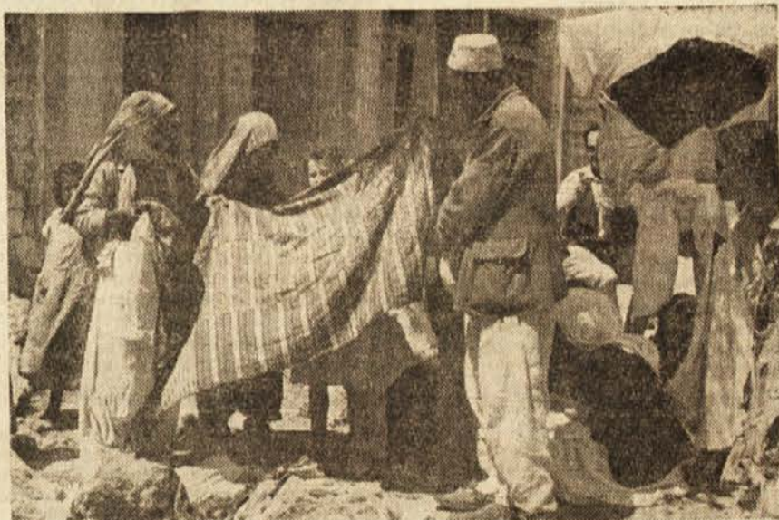
Na čaršiji v Ulcinju.

Ta ustaški zločinec je leta 1935 postal član ustaške teroristične organizacije in je v Italiji dokončal teroristično šolo. V aprilu 1941 je prišel s krvnikom Pavelićem v Zagreb in dobil važen položaj v ustaškem glavnem stanu. Leta 1942 ga je Pavelić kot zaupnega človeka poslal v Slavonijo, kjer je ustanovil taborišča za zaprte rodoljube in organiziral ustaške kazenske ekspedicije. Na njegov ukaz so zaprli 120 ljudi iz okolice Slatinskega Brenovca, ob koncu leta 1942 pa več kot 170 Srbov iz okolice Virovitice. Te rodoljube je poslal nato v taborišče smrti v Jasenovcu, o koder se nobeden ni vrnil. Isto usodo je doživelo tudi 100 Srbov iz okolice Slavonske Orašovice. Na njegov ukaz so v okolici Vočina zverineško poklali več kot 500 ljudi. Obtoženec je odražal množične aretacije, mučenja, kljanje in preganjanje Židov in ropanje njihovega imetja.