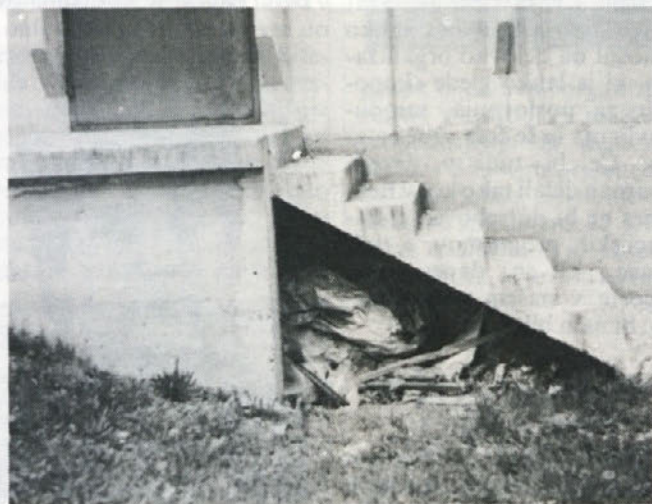
SAJ SE NE VIDI — Pa se. To je isto, kot bi snažilka pospravila smeti pod preprogo. Nekaj časa bi bile skrite, nato bi prišle na dan. V naši očiščevalni akciji, traja naj vsak dan, vse leto, bomo pospravili tudi takšne »skrite« koticke. Za kamero Branka Matkoviča, kaže, ni nič skritega.