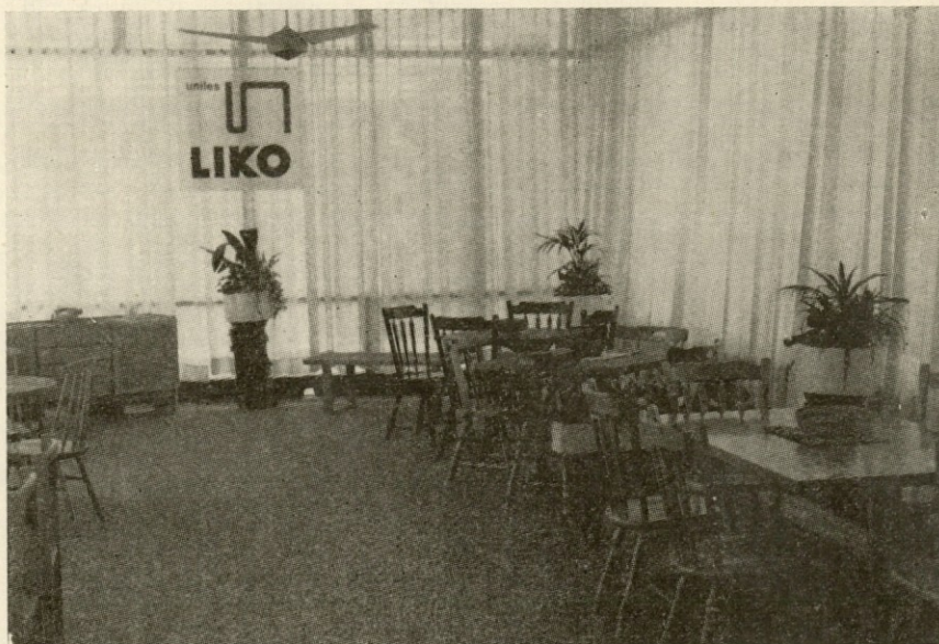
Likov razstavní prostor na razstavi »Salon pohištva« v Ljubljani

O dopolnitvi se bodo odločali samo delavci TOZD TOVARNA VRAT. Pri tem gre za dopolnitev dejavnosti temeljne organizacije Tovarna vrat, s čimer bo podana možnost, da se Prodajno skladišče na Vrhniki evidentira v sestavi temeljne organizacije Tovarna vrat.