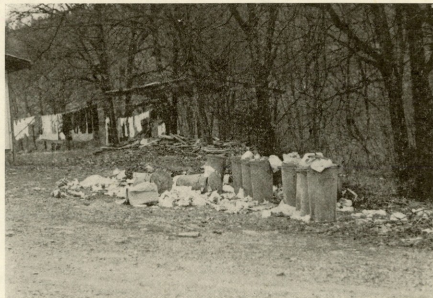
Urejena okolica samskega doma na Verdu?!

Že pred leti je Žago na Ljubljanskem vrhu uničil ogenj. Nekaj tega, kar je ogenj pustil pa še vedno klubuje vsem vremenskim neprilikam in s tem ohranjajo spomine na dobre stare čase. Morda pa je to spomenik?