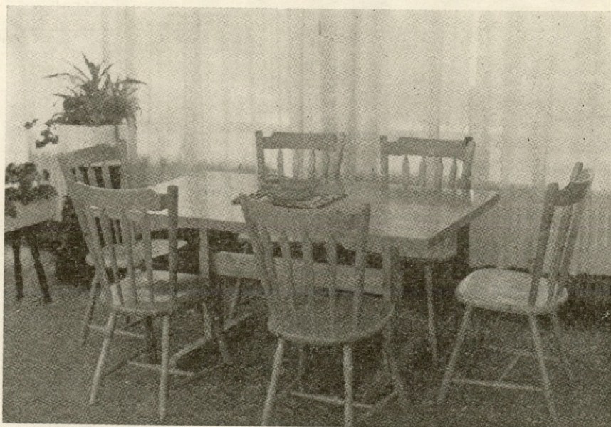
Naša sedežna garnitura na »Salonu pohištva«

Takole pa zgleda pot na Triglav pozimi v začetku januarja. Snega je na metre, mraza in vetra pa v izobilju. Na Kredarici pa kljubujejo zimi le meteorologi in zelo redki obiskovalci.