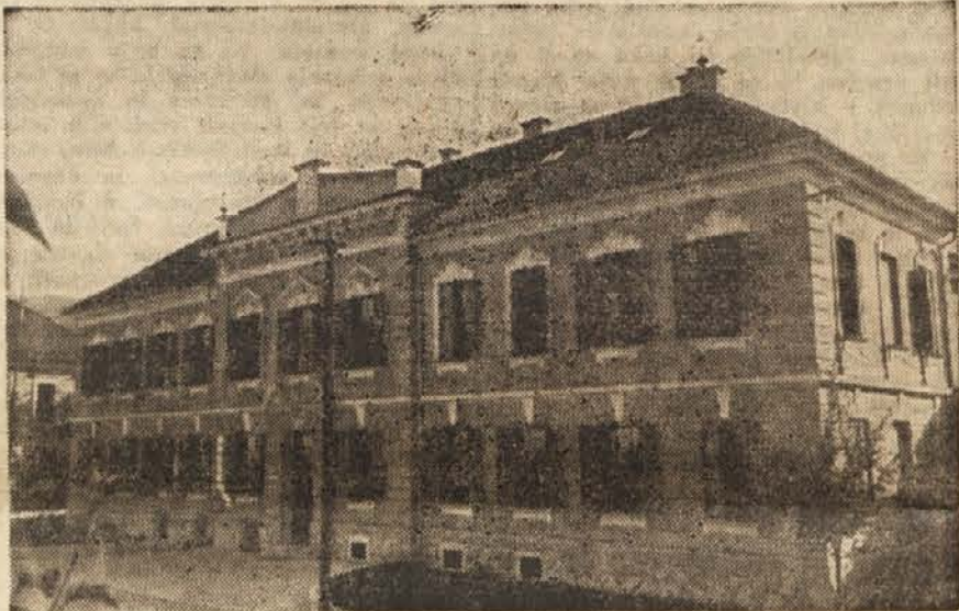
Dom koroških dijakov v Radovljici, kjer je nameščena počitniška kolonija

Mladinske brigade so prostovoljno izdelovale opeke. V opekarni »Cvetko Dimov« v Skoplju je bila organizirana v začetku maja prostovoljna mladinska delovna brigada. Mladinci so v dveh mesecih dosegli velike uspehe. Izdelali so nad 3 milijone zidakov. Zdal jih bo zamenjala druga skupina mladincev, ki bo izdelala okrog dva milijona opeke. V Makedoniji potrebujejo za številna gradbena dela še tem več opeke, ker jim primanjkuje kamna.