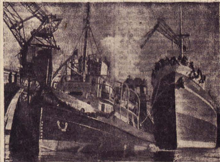
VLACILEC »PROLETER« IN MOTORNA LADJA »TITOGRAĐ« PRED SVOJO PRVO VOZNOJO