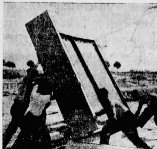
Stahllamellenhaus-Siedlung: Aufrichten einer Stahlwand mit Ecklamellen.

Die hier zur Anwendung gekommene Bauweise ist eine Stahllamellenbauweise. Das Standard-Wandelement für die Außenwände ist die sogenannte Stahl-Lamelle, das sind Siemens-Martin-Stahlbleche, welche an allen Ecken rechtwinklig in einer Tiefe von 8 cm gebördelt sind und eine Größe von 1.15 x 2.30 Meter haben. Diese Stahllamellen werden durch Sockelanker mit dem in Beton hergestellten Fundament verbunden, un-