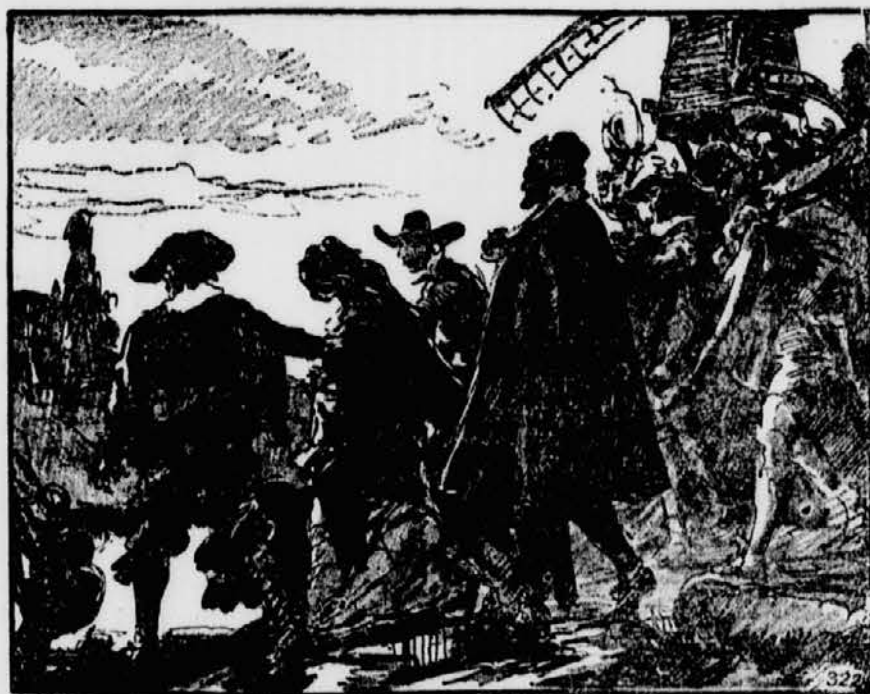
Auf dem letzten Weg

ergriff und mit sich zog, so wie das Schicksal einen Menschen zu etwas Schrecklichem führen kann. Sie versuchte keinerlei Widerstand. Gutwillig folgte sie. Lord Winter, d'Artagnan, Athos, Porthos und Aramis schlossen sich an. Draußen folgten auch die Diener dem merkwürdigen Zug und das kleine Zimmer, in dem sich diese furchtbare Tragödie abgespielt hatte, stand nun mit zerbrochenen Fensterscheiben, offener Tür und qualmender Lampe verlassen da.