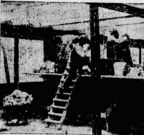
Stahlstützen mit Unterzug. Brandmauer zwischen zwei Wohnungen.

Die Stahlbauweise hat für die Herstellung derart schnell zu vorteilfender Wohnungen den großen Vorteil, daß nur sehr wenig Feuchtigkeit in den