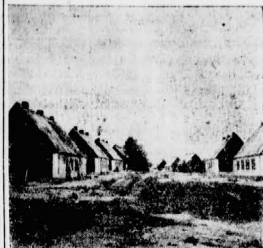
Ein Straßenzug in der Stahllamellenhaus-Siedlung, in welcher 70 Familien untergebracht wurden.

Die Stahlaußenwände sind im Inneren mit 3.5 cm starken Heraklith-Platten ausgekleidet. Die Zwischenwände bestehen aus 5 cm starken Hera-