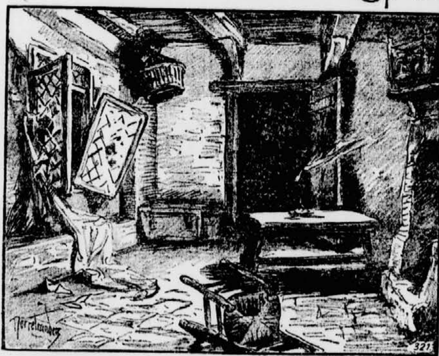
Das leere Zimmer

Athos streckte seine rechte Hand gegen sie aus und sagte: »Charlotte Backson, Gräfin de la Fere, Lady Winter! Ihre Verbrechen schreien zu den Menschen hier auf Erden und zu Gott im Himmel. Können Sie noch ein Gebet, dann beten Sie jetzt, denn Sie sind verurteilt und müssen sterben.« Bei diesen Worten, die Mylady aller Hoffnung beraubten, erhob sie sich zu ihrer vollen Höhe und versuchte zu reden, aber ihre Kräfte verließen sie. Sie fühlte, wie eine starke, unerbittliche Hand sie an den Haaren