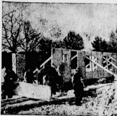
Ein Hauswand aus Stahl steht.

Die schnellere Unterbringung von Arbeitskräften in größerer Zahl ist eine häufig sehr dringende und nicht immer leicht zu lösende Aufgabe, die noch dadurch erschwert wird, daß die Baustoffe stellenweise sehr knapp sind. Wie man solcher Schwierigkeiten Herr werden kann, zeigen zwei Arbeiterfiedlungen, die in diesem Jahre bei Berlin entstanden sind. Unter Zuhilfenahme der Stahlhausbauweise wurden hier in kürzester