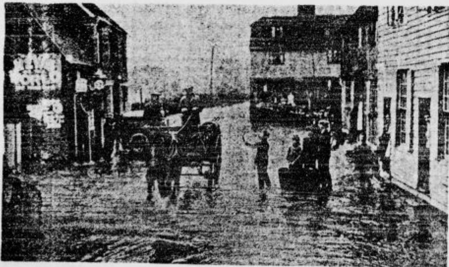
Povodnji v severni Italiji. Reke pri Gorgonzoli v sev. Italiji so tako narasle, da je več krajev pod vodo. Kmetje so morali iz hlevov gnati živino na višje ležeče ceste, da so jo rešili vode.

Mi seveda se ne moremo meriti s temi narodi in ne moremo storiti vsega tega za naše izseljence, kar ti store za svoje. Gotovo je pa tudi, da bi veliko več mogli in morali storiti, kakor smo do zdaj storili. Tedaj, ko je bilo naše izseljevanje na vrhuncu, smo mi spali, drugi narodi so pa pridno delali. Zbudimo se vsaj zdaj in pojdemo na delo in rešimo, kar se še rešiti da. Družba sv. Rafaela in Ljubljani sama ne zmore tega dela, treba je, da jo podpre ves narod z denarnimi žrtvami. Danes šteje omenjena družba par sto članov — naših ljudi pa je v tujini več stotisoč. Ne smejo bi biti pri nas hiše, ki ima v tujini svoje člane, pa da bi ne bila članice Družbe sv. Rafaela. Mislim, da bi prav lahko vsaka taka hiša prispevala kot članica letno po deset dinarjev. Šele tedaj, ko bo ves naš narod podprl težko delo Družbe sv. Rafaela z denarnimi prispevki, bo šlo delo od rok. Korist tega dela pa ne bodo občutili samo naši izseljenci, temveč tudi naša država. Ne pustimo, da bi naši bratje in sestre popolnoma pozabljeni od domovine utonili v tujini in da bi med njimi zamrla naša beseda in pesmi!