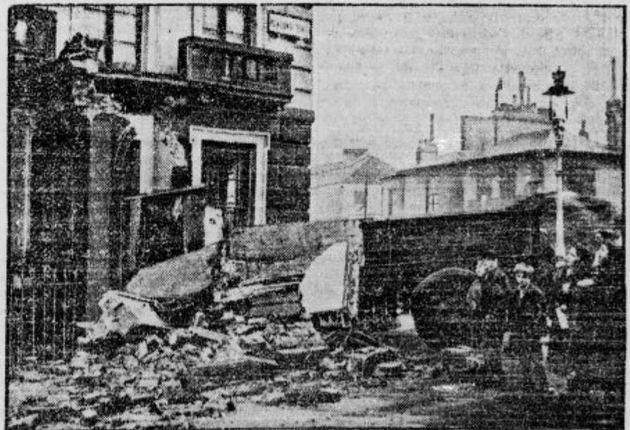
V Londonu se je priklopni avtomobil odpel od motornega avtomobila ter zdrčal po strmini navzdol in se s tako silo zaletel v neko hišo, da je ves prednji del podrl

S tem je prva doba naše stranke uspešno zaključena in stranka prihaja v drugo, važnejšo, ko bo treba vse sile napeti za to, da pribori narodu onih pravic, ki mu v svobodni državi gredo. Zavedajmo se, da bo stranka samo toliko dosegla, kolikor bo njeno članstvo po številu močno in disciplinirano. Zato veljaj za vsakega poštenega Slovenca geslo: Edino v Jugoslovanski radikalni zajednici se je v danih razmerah mogoče uspešno boriti za naše pravice.