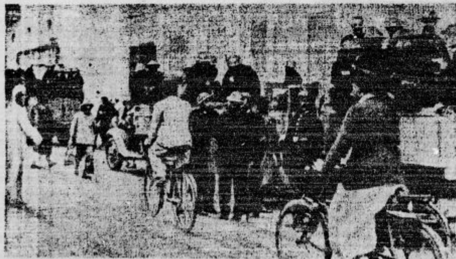
rva slika iz krvavih nemirov v Kairu. Anglo-egiptovsko vojaštvo prvi dan nemirov se pripravlja, da poseže vmes. Pri nemirih je bilo mnogo mrtvih in ranjenih.