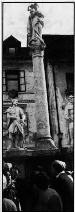
Udeleženci izleta Kluba prijateljstva pod "kužnim znamenjem" v Škofji Loki

Popoldne smo se odpeljali v Crngrob. Tam stoji na griču, s katerega je čudovit razgled, znamenita cerkev Marijinega oznanjenja. Že zunanost je zanimiva s freskami iz prejšnjih časov in z veliko lopo na stebrih. Že od daleč pozdravlja potnika velika freska sv. Krištofa, ko nosi Jezuščka čez reko, polno rib in povodnih mož. Notranost, ta je šele zanimiva! Cerkev je zgrajena na manjših starih cerkvah, od katerih so v stranski ladji ohranjene nekatere freske. Tu visi na steni tudi prava posebnost: rebro ajdovske deklice. Ajdi so bili velikani. Ljudska pripovedka pravi, da je ajdovska deklica, ki je sicer pasla drobnico, pomagala trpečim tlačanom graditi cerkev. Stopila je z vsako nogo na eno goro in iz reke zajemala vodo, pa tudi lomila kamenje. Najbrž je to velikanško rebro kake živali in ga je morda kak romar prinesel od