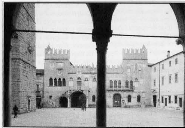
V središču starega Kopra

Okoliške občine (Devina, Nabrežina, Zgonik, Repentabor in Dolina na Tržaškem ter Doberdob, Sovodnje in Števerjan na Goriškem) v večji ali manjši meri uporabljajo dvojezičnost.