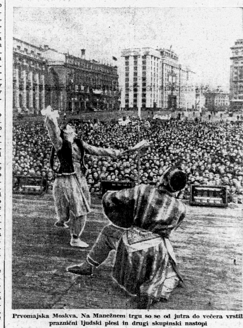
Prvomajska Moskva. Na Manežnem trgu se se od jutra do večera vrstili praznični ljudski plesi in drugi skupinski nastopi

Umetniška skupina Jugoslovanske armade se vrača v domovino s kar najboljšimi vtisi. Bila je na vsej poti iskreno pozdravljena in spreje- ta tako od predstavnikov kulturne- ga in umetniškega življenja kakor od ljudstva ter je tako s svojo uspešno kulturno misijo doprinesla velik delež k zbliznanju med naši- mi in zapadnimi narodi. S svojimi nastopi in z neposrednim stikom z najširšimi ljudskimi plastmi v za- padnih deželah pa je prav tako mnogo doprinesla k pravemu in resničnemu poznavanju, ki ustvari- vi resnične podobe življenja in pro- speha naše ljudske države, ki ga skuša mednarodna reakcija na vse možne načine prikriti in klevetati pred svetom.