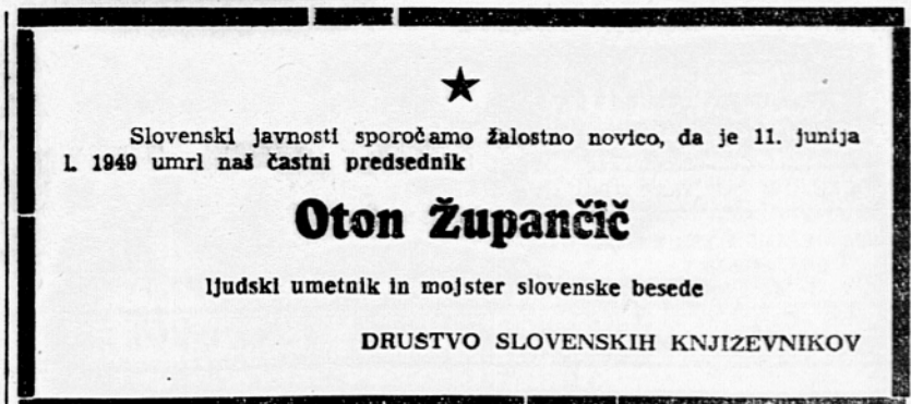
Slovenski javnosti sporočamo žalostno novico, da je 11. junija 1949 umrl naš častni predsednik Oton Župančič

Mo leto preokreta v naši trgovini, državni sektor prevzel vodstveni položaj in je konec leta sodeloval v trgovini za 42%, združeni s 46%, zasebni pa le za 14%. V blagovnem prometu je državni sektor sodeloval s 33,1%, združeni s 36,6%, privatni pa s 1,1% od celotnega prometa v naši državi.