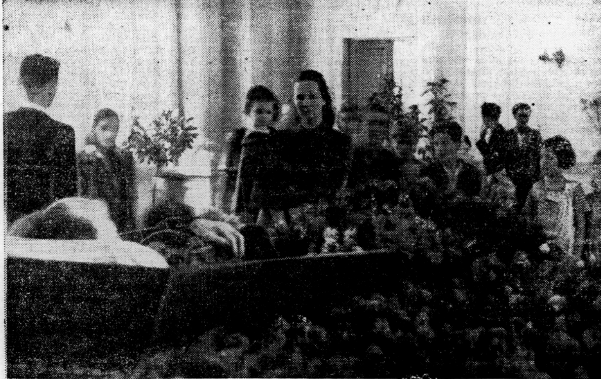
Pokloni pri svojem pesniku

»Spričo smrti zvestega sinu ljudstva in neumrlega pesnika Otona Župančiča, ki je težka in bolesta izguba za vse naše narode, sprejmite naše najgloblje sožalje.«