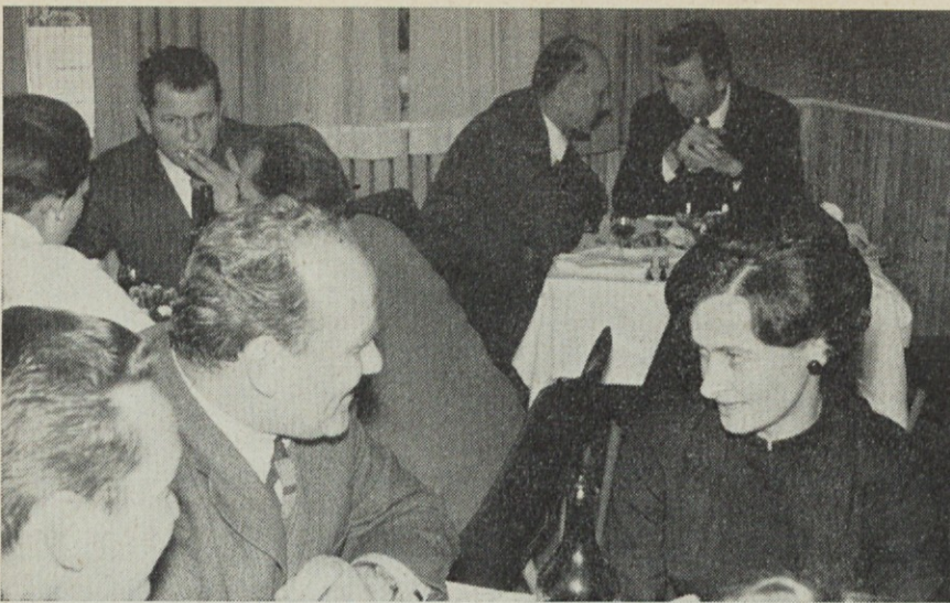
Kmalu nato je razgovor stekel. Prijeten, domač, sproščen, poln spominov, občutkov, želja