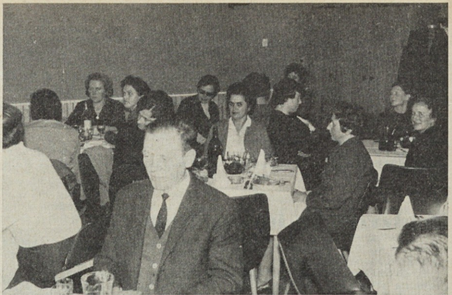
Četrtekov večer, 27. novembra, neposredno pred praznovanjem Dneva republike, smo namenili našim jubilarcom

Zaradi tega, ker so nekateri besedilo amandmaja razumeli tako, da so v svojih statutih želeli uveljaviti zahtevo, da dobi dosedanja kolegij — posvetovalno telo direktorja — status izvršilnega organa upravljanja, je potrebno o tem povedati nekaj več. Kolegijske izvršilne organe je treba razumeti le kot izvršilne organe kolektivne sestave, ne pa tako, da se upravljanje navezuje iz-