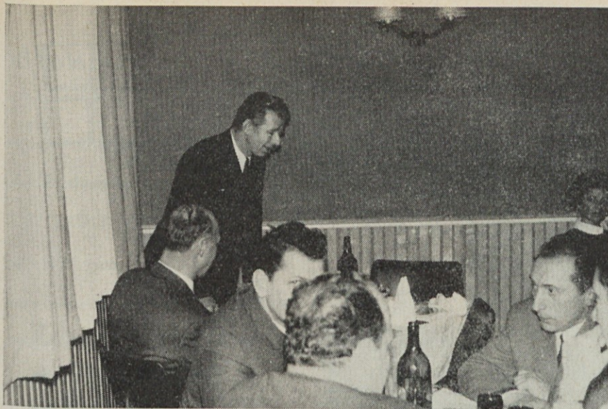
Cez čas je spregovoril še direktor. Ni govoril dolgo, njegove besede pa so zadele v polno