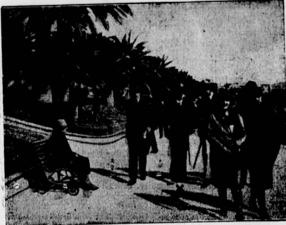
Der Reichsaußenminister (X), der sich nach der Genfer Tagung des Völkerbundes zur Erholung nach San Remo begeben hat, beim Spaziergang auf der dortigen Kurpromenade.