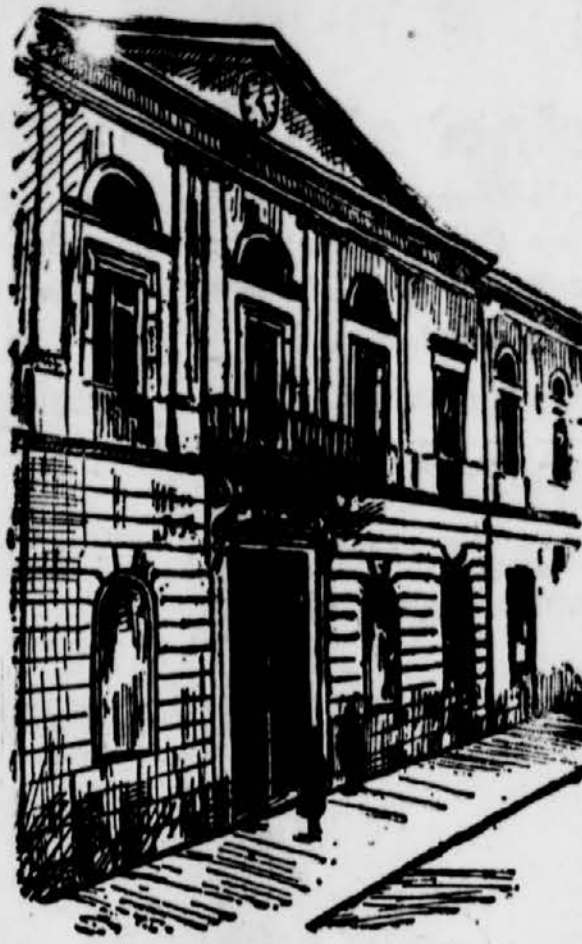
die wegen der Studentendemonstrationen gegen die Diktatur durch königliches Dekret bis Oktober 1930 geschlossen wurde.

— 13.30: Wasserstand und Börsenberichte. — 17: Jazz. — 18.30: Landwirtschaft. — 19: Tschechisch. — 19.30: Geschichte der Slowenen. — 20: Abendkonzert. — 22: Nachrichten und Zeitangabe. — 22: Koncert des Wiener Sinfonieorchesters. — 23: Abendmusik. — 23.15: Englisch. — 20: Tag des Buches. — 21.30: Koncert. — 22.30: Tanzmusik. — 24.30: