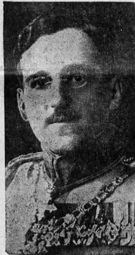
NJ. VEL. KRALJ ALEKSANDER I.

Položaj bana je postavljen na višjo stopnjo s tem, da ga postavlja kralj z ukazom na predlog predsednika vlade. Ban predstavlja v banovini celokupno oblast.