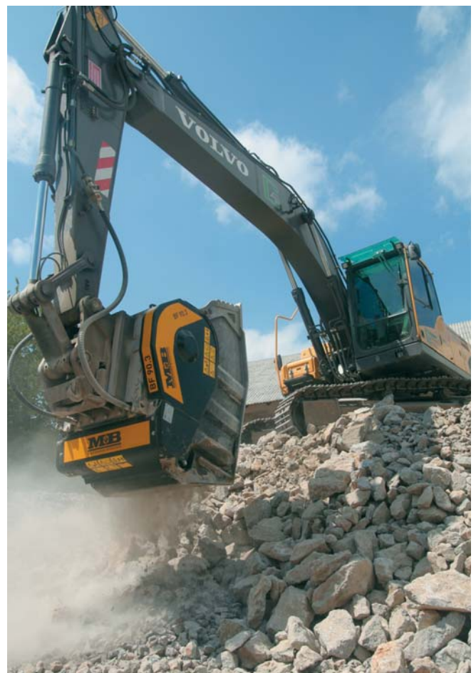
Stroj pri delu

stroj in da je dela ogromno. Zato sem čez dobro leto kupil bager goseničar in zaposlil prvega delavca. Nekaj vam povem: ne prenesem jamranja in črnogledosti. Če hočeš in če delaš, lahko premagaš vsako krizo, o kateri govorijo.