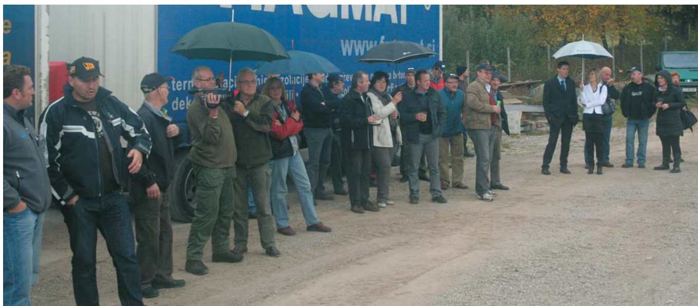
V pričakovanju predstavitev