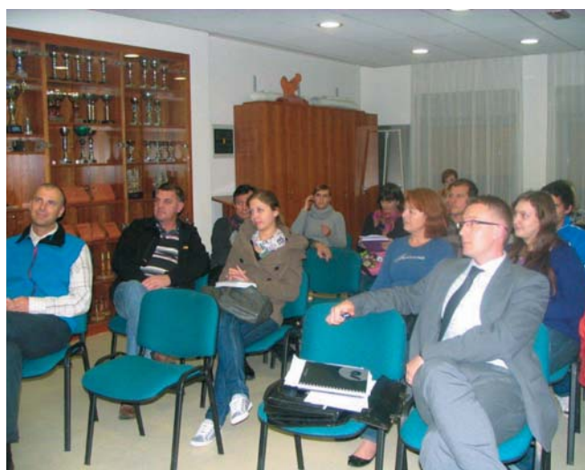
Del udeležencev seminarja o fotobranju

Začeli smo s predpostavko, da je vse igra, z ugotovitvijo da so možgani povezani, da moramo biti osredotočeni ter ugotovili pomembnost učenja v sodelovanju.