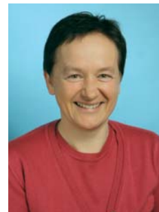
Pripravljala Adela Cankar