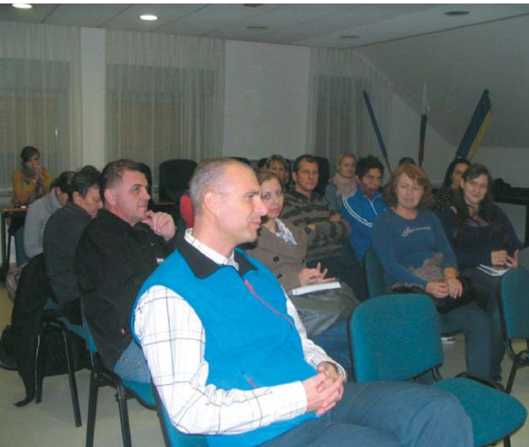
Pogled na udeležence še z druge strani

Za samo fotobranje pa je potrebnih pet korakov: priprava, pregled, fotobranje, popregled in aktivacija. Če uporabimo temelje in preidemo na vseh pet korakov, bomo ugotovili, da tekste beremo hitreje, da jih bolje razumemo in končno, da smo prihranili nekaj časa, ki ga lahko porabimo na drugih področjih.