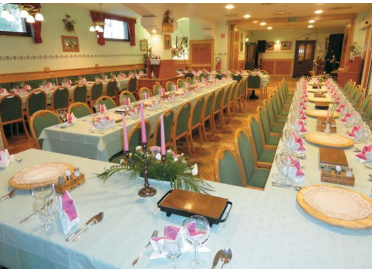
Restavracija, pripravljena za poročno slavo

Da. Gostinci pa se morajo zavedati, kaj izraz gostilna pomeni. To ni picerija in ni bife. Potrebna je nenehna skrb za različne izboljšave. Vse, kar ponujaš, mora znati natakati tudi prodati. Gostje pa ti ne smejo sestavljati jedilnika: jaz bi pa kalamare, jaz bi ribe, a imate? Široka ponudba je zanje sicer vabljiva, ni pa mogoče pričakovati, da bo obenem kakovostna, vrhunska, kakršna mora biti. Na videz nasprotujoča si trditve: manj je več v tem pogledu zanesljivo drži. Kar nudiš, ponudi mojstrsko, ponudi sveže pripravljeno, ne pogreto in vnaprej napol pripravljeno ali zamrznjeno.