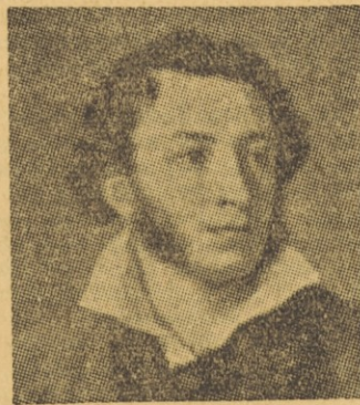
ALEKSANDER SERGEJEVIČ PUSKIN

Dne 10. februarja 1837 je padel o doboju ruski pesnik Aleksander Sergejevič Puškin (rojen 6. jun. 1799 o Moskvi). V svojih pesnitvah se je oslonil na ljudsko izročilo in postal tako zračnik nove smeri o ruski književnosti. S svojimi svobodoljubnimi pesmimi se je hudo zameril carskemu režimu in bil zato več let o pregnanstvu na Kavkazu. Njegovo največje delo je roman o verzih »Evgenij Onjegin«, ki ga poznamo tudi kot opero skladatelja Čajkovskega.