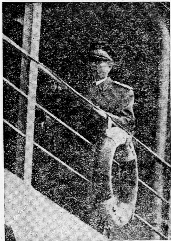
Predsednik Tita na »Galebu«

Vremenska napoved za ponedeljek: Oblačno in hladno vreme, ponoči srpa dež, deloma nevihtnega značaja, pozneje bo začelo snežiti tudi v nižinah. Čez dan se manjše snežne padavine, vendar bodo nastopile pozneje delne razjasnitve, predvsem v severni Sloveniji. Na Primorskem burja, ki se bo ponoči še pojačala. Temperatura med 4 in +2, na Primorskem do 5 stopinj.