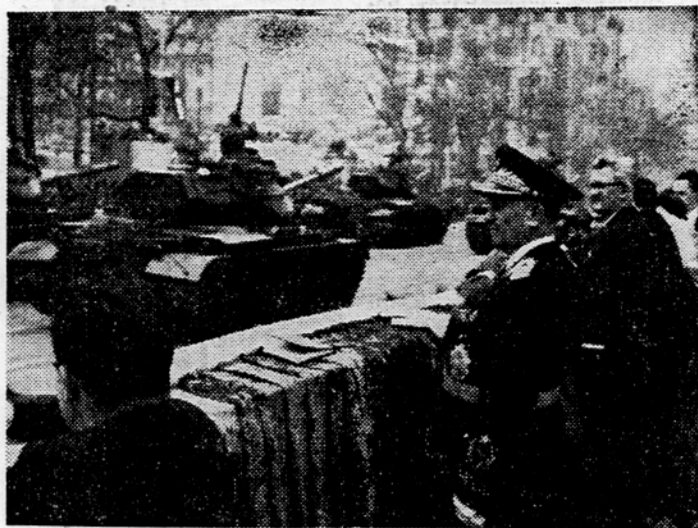
Motorizirane, pehotne, konjeniške in druge enote Jugoslovanske ljudske armade so 1. maja defilirale v Beogradu poleg tribune, na kateri je bil predsednik republike maršal Tito z drugimi državniki Jugoslavije in tujimi vojaškimi in diplomatskimi zastopniki.

Zvezni izvršni svet je sprejel uredbo o spremembah in dopolnitvah uredbe o plačah delavcev in uslužbencev gospodarskih organizacij, ki se stoje v glavnem v izračunavanju obračunske plače delavcev in uslužbencev. Tako je v dodanem drugem odstavku člena 6. rečeno, da gre v obračunski sklad plač razen zneskov, ki jih vsebuje prvi