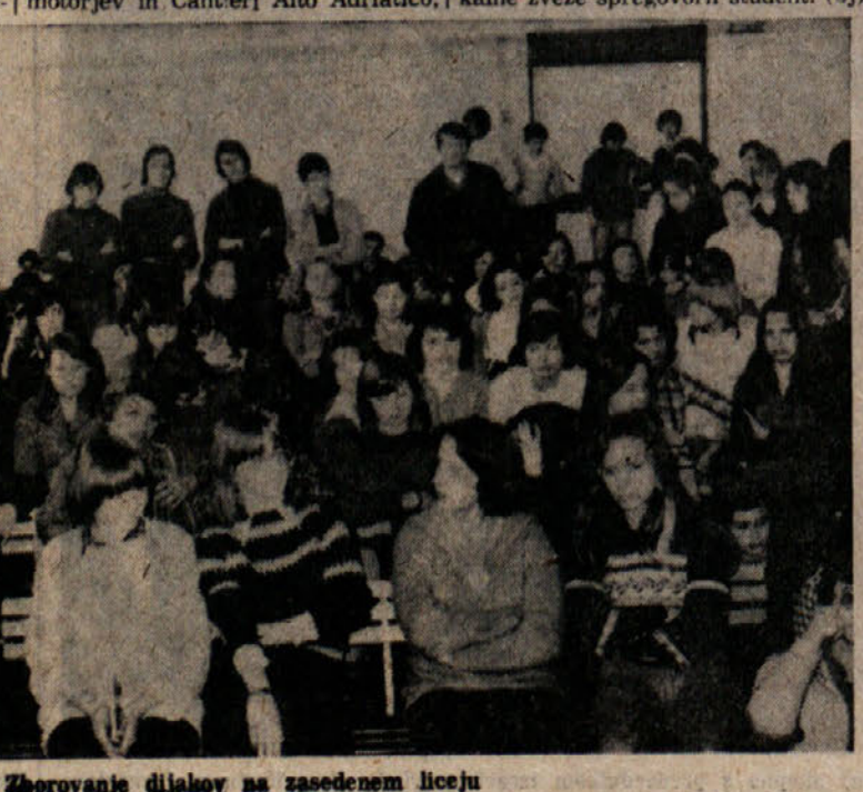
Zborovanje dijakov na zasedenem liceju

Prisotna sta še bila predstavnik delavskih svetov Tovarne velikih motorjev in Cantieri Alto Adriatico.