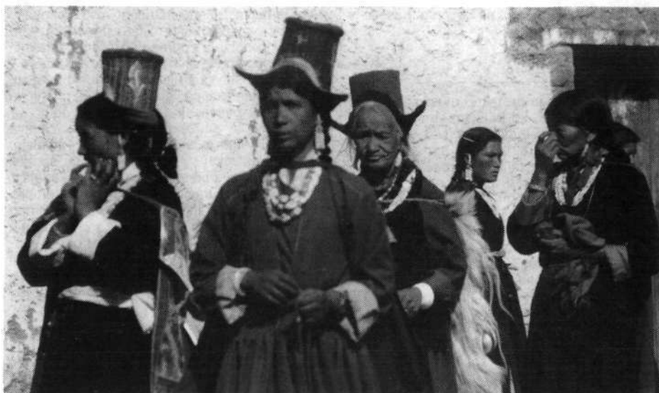
Ladačanke v prazničnih oblekah na festivalu v vasi Tak-tak (Traktok)

pokrajina in stalno drseča pobočja, na katerih je komajda moč vzdrževati cesto.