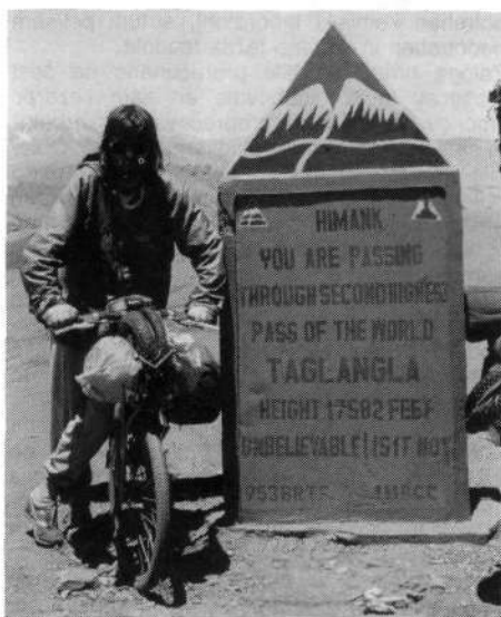
Najvišja cesta na svetu: na njej se lahko pogovarjate z bogom

karavane vernikov iz malodane vse Indije. Verski fanatiki so ljubosumno varovali nekatere relikvije, ki se jim brezverci najinega kova niso smeli približati. Edini pravi verniki, popotni saduji, ki jim življenje mineva na poteh med Gangeško nižino in svetišč v Himalaji, so bili veliko bolj dostopni. Mnoge naslednje dni smo preživeli skupaj pod skalnimi pečinami globokih sotesk ter čakali, da se bo monsun unesel. Bili so dnevi, ko sva na pot lahko šla šele na večer, ki je v temo zavil strme prepade, ti pa so kar čakali na kako najino napako. Bliže sva bila južnemu robu Himalaje, obilnejši so bili darovi z neba in le slikovite vasice, položene v naročje mehkih zelenih teras, so naju s svojimi ljudmi obdržale na kolesih. Žareče oglje otroških oči je strmelo v najini prikazni, drveči po blatnih cestah in vedno znova podžigalo najina ognja poti. Hišni gospodar v eni izmed dvarhatskih domačij naju je zazibal v sen z recitiranjem Bagavadgite, po strmih serpentinah pa so naju poganjali šumi zibajočih se borov.