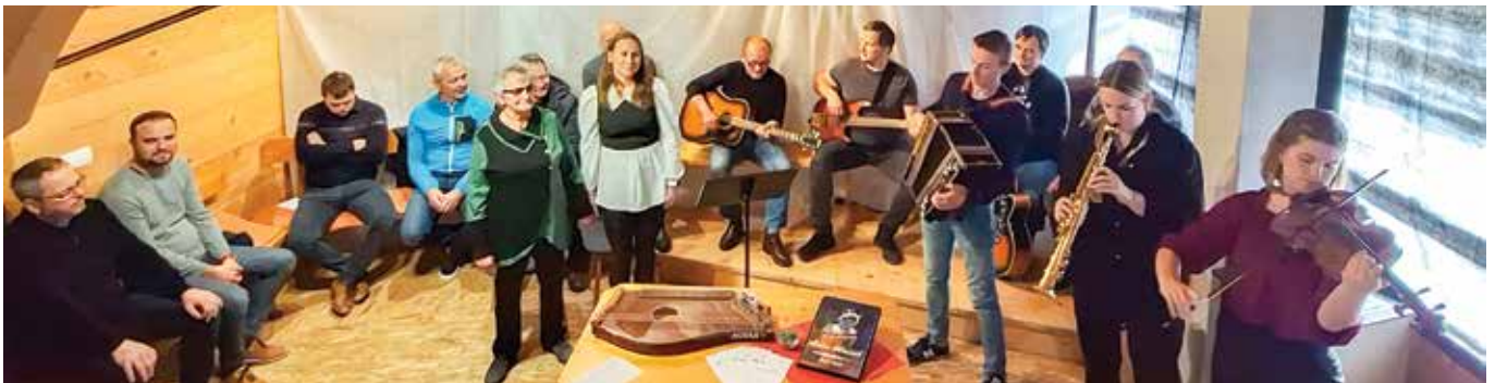
Za izvajanje pesmi so poskrbeli Mlačnikovi sorodniki, ki so vsi izvrstni vokalisti in instrumentalisti, pridružili pa so se jim tudi člani okteta Žetev.