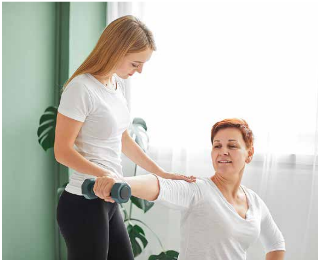
Kineziolog skrbi tudi za pripravo preventivnega vadbenega programa, iz katerega posameznik v krajšem časovnem obdobju učinkovito odnese največ.

ter ohranjanja optimalnega zdravja. Kot rečeno, na kineziologa se lahko obrnete po zaključeni fizioterapevtski obravnavi, v sklepni fazi rehabilitacije po poškodbi ali operaciji, ko je potrebno odpraviti napačne vzorce gibanja, ki so nastali kot posledica poškodbe ali bolečine. Kineziolog vam lahko pomaga tudi kadar nimate poškodbe, vendar občutite bolečino ali omejeno gibljivost pri izvajanju vsakodnevnih opravil ali kadar se želite preventivno zaščititi pred novonastali-