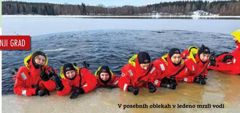
V posebnih oblekah v ledeno mrzli vodi

Po prespani noči so ponje prišli z avtobusom njihovi finski prijatelji. Sledila je vožnja po zanimivi finski pokrajini, polni gozdov in jezer. Prispeli so v Virrat, v mladinski center Marttinen, kjer so bivali vse nadaljnje dni. Skupaj z gostitelji so pripravili veliko različnih dejavnosti, ki so jih, kot so ugotovili na koncu, resnično povezale. »Najbolj si bomo zapomnili, da smo se lahko v posebnih oblekah potopili v ledeno mrzlo vodo, da smo obiskali savne in izvedli njihovo tradicionalno dejavnost, in sicer da potem, ko se v savni ogreješ, skočiš še