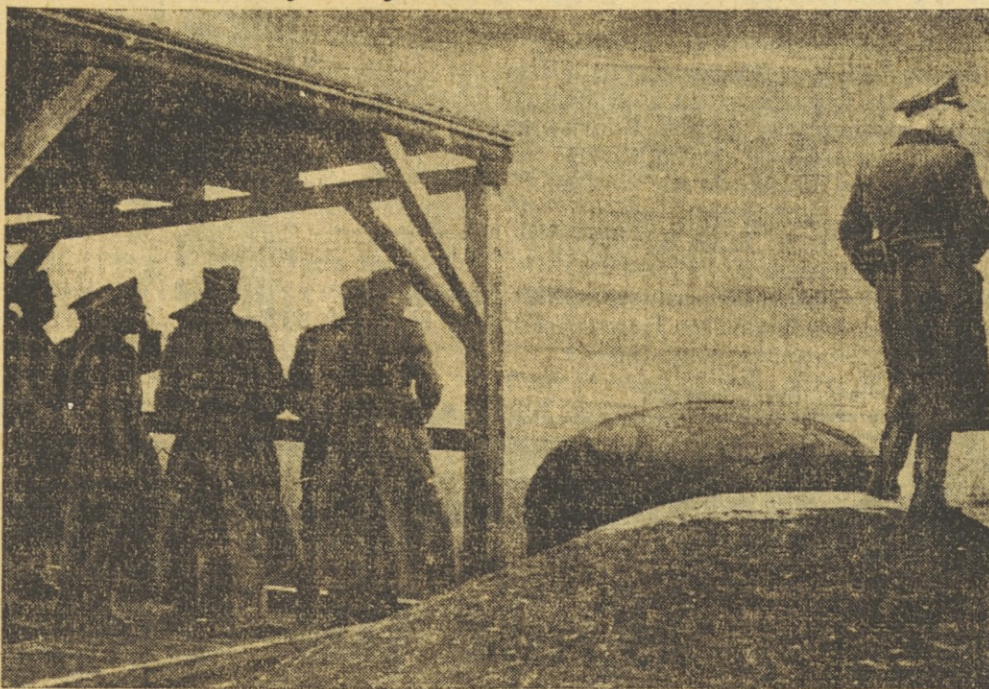
Ausblick von den Festungswerken Verduns.