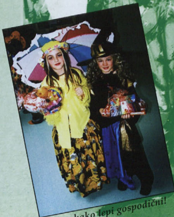
Uau, kako lepi gospodični!