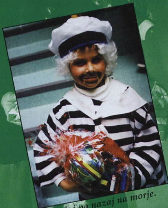
Sedaj pa nazaj na morje.