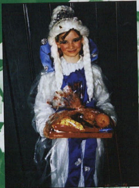
To je kraljična, ki je zelo zadovoljna z nagrado.

V zraku diši po zgodnji pomladi, po flancatih, krofih in marmeladi.