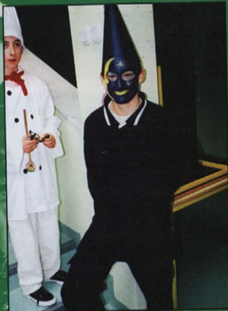
Noč ima svojo moč!

V sredo pokopljemo starega pusta, krofe pa jemo še tja do avgusta.