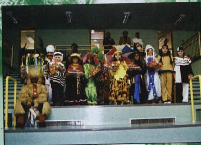
Kako lepi nagrajenci ... Najboljši!!!