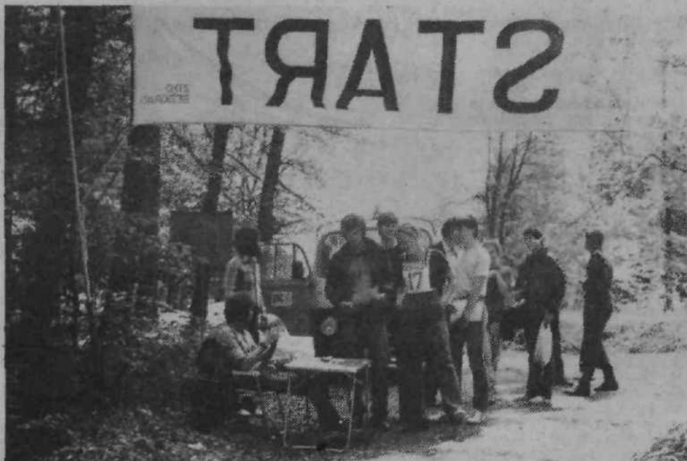
Start je bil v tako imenovani Sračji dolini, na začetku trimske steze. Petčlanske mešane ekipe so od tam hitro krenile proti kontrolni točki, kjer jih je čakala prva naloga, prva preizkušnja znanja (zgoraj). V primeru splošnega ljudskega odpora ali elementarnih nevarnosti mora praktično vsako obvladati osnove prve pomoči, zato so morali člani ekip praktično oskrbeti poškodovanca ter odgovoriti na nekaj teoretičnih vprašanj. Pri tem člani komisij niso bili samo izpraševalci, ampak so tekmovalcem tudi pojasnjevali napake in jim razlajali znanje. (spodaj levo)