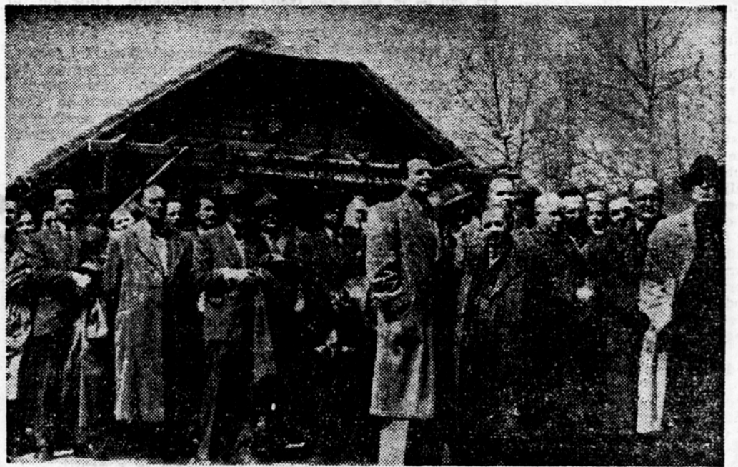
Otvoritev vinarske razstave. V ozadju paviljon podjetja »Slove nija vino«, ki ima obliko prikupne dolenske zidanice.

vključevanje žena in mladine v gasilstvo, politična vprašanja itd. V splošnem pa je bilo v poročilih ugotovljeno, da postaja prostovoljno gasilstvo v reševalni službi že kos vsem postavljenim nalogam in da ni več daleč čas, ko bodo gasilske enote lahko postale mojstri svojega dela. Po poročilih je sledila načelna razprava. —ms—