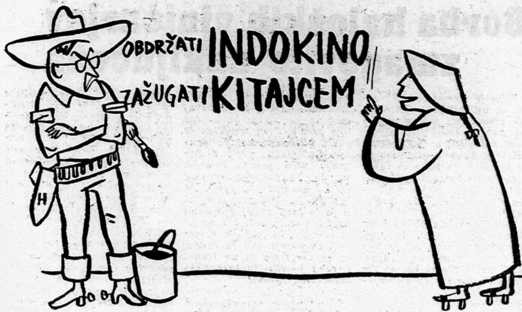
»Z drugim delom obeh stavkov, minister Dulles, se popolnoma strinjamo! Mi namreč čitamo navpično!

Kairo, 24. aprila (AFP). Kakor piše egiptovski poluradni časopis »Al Gummhria«, je bila v pristanišču Adahija, v Sueskem prekopu velika eksplozija, ki je uničila pristanišne naprave in onemogočila vsako delo. Zastopnik britanskega veleposlanstva v Kairu, ki je potrdil vest o eksploziji, je izjavil, da je poskodovan samo en električni generator in da človeških žrtev ni bilo.