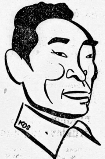
Cu En Laj

Zeneva, 24. aprila (Reuter). Kitajski minister za zunanje zadeve Cu En Laj je prispel danes v Zenevo s člani kitajske delegacije. Z njim sta tudi pomočnika ministra za zunanje